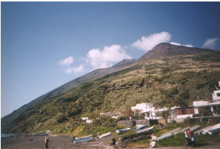
foto 3 la spiaggia nera di Scari

La scelta di destinare a Servizi la zona, comporterebbe la sistemazione nella cava del Centro Stoccaggio Rifiuti, ora ubicato provvisoriamente lungo la Via Marina, anche quella una scelta infelice, nonché la costruzione di una strada di transito per i mezzi motorizzati, strada che distruggerebbe la duna e praticamente annullerebbe la spiaggia nera, una delle maggiori attrazioni turistiche dell'isola.