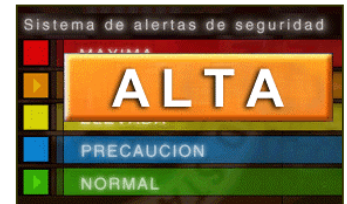
Sistema de Alertas da Seguridad

que los recientes atentados terroristas en Arabia Saudita y Marruecos "pueden ser el preludio de un ataque en Estados Unidos". Sin embargo, funcionarios de los organismos de seguridad estadounidenses aclararon que el mensaje decía que el FBI no tiene información acerca de una amenaza específica. El mensaje pidió a los organismos policiales locales a alertar sobre actividades sospechosas y mantenerse vigilantes sobre potenciales operaciones terroristas en Estados Unidos. Este fue el segundo mensaje enviado por el FBI en cuatro días expresando preocupación sobre un posible ataque dentro de Estados Unidos.