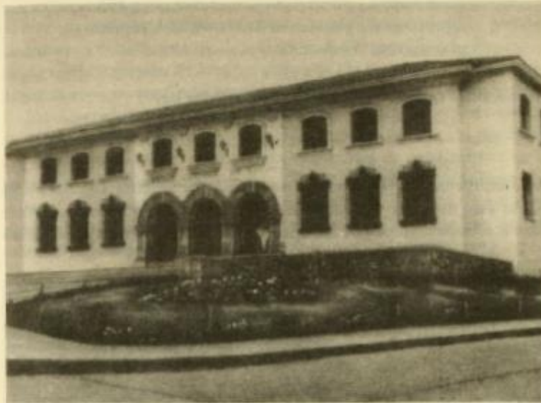
Jefatura Zonal del Servicio Nacional de Salud.

pueblecito de esa región llamado La Unión. Y así el pisco chileno Pisco Elqui tuvo libre entrada en los Estados Unidos.