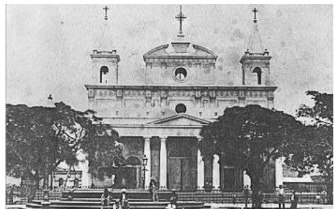
Catedral de San José, 1890