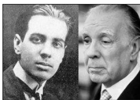
Jorge Luis Borges (1899-1986)

La investigación permite concluir que Borges descendía de un grupo de intelectuales ingleses del siglo XIX, cuyas características quedaron plasmadas en la obra y el pensamiento del célebre escritor, quien nació en Buenos Aires en 1899 y falleció en Ginebra en 1986.