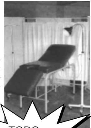
Diván ginecológico de dos posiciones

Colores: blanco humo, beige, marfil, verde clínico y gris.