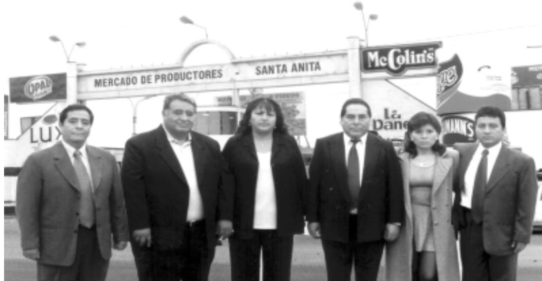
Consejo Directivo de APAMSA que le viene dando una nueva imagen al Mercado de Productores Santa Anita

- Dentro del objetivo de preparar mejor a los asociados para que vendan