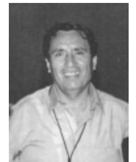
Oscar Benavides Majino, Primer Alcalde del Perú

se viene reclamando el incremento de los recursos del canon minero, y un aumento en los recursos destinados a programas como el Vaso de Leche, principalmente para las zonas más pobres del país, donde miles de niños padecen de desnutrición.