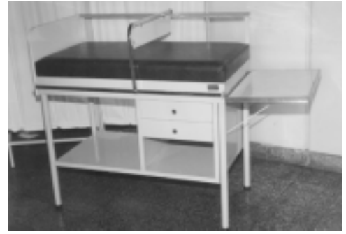
Diván pediátrico amoblado con tallímetro, fabricado en planchas laminadas al frío de 1/32 Acabado especial, secado al horno.