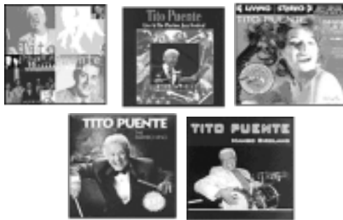
Tito Puente y los que se consideran son sus cinco disco-estrella, del ciento y pico que grabó a lo largo de su larga carrera profesional.

Tito Puente (1923-2000), compositor y percusionista estadounidense conocido por sus vigorosas interpretaciones con los timbales. Su popularidad ayudó a difundir la música latinoamericana, y en especial el mambo, en Estados Unidos.