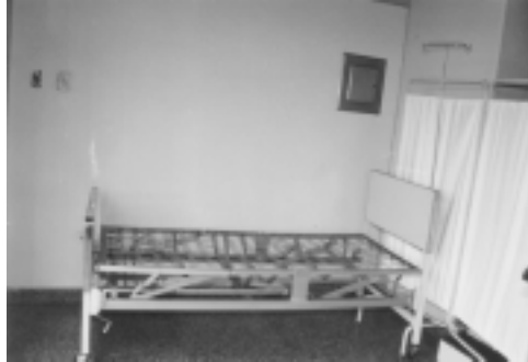
Cama Clínica de 02 manivelas, cromada, pieceray, cabecera contraplacada. Portasuero incorporado con llantas pesadas con frenos. Somier tejido en nozart, una manivela es a la altura de la cabeza, y la otra a la altura de la ordilla.