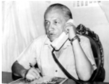
En honor de un buen amigo, que en paz descansa, abrimos esta columna