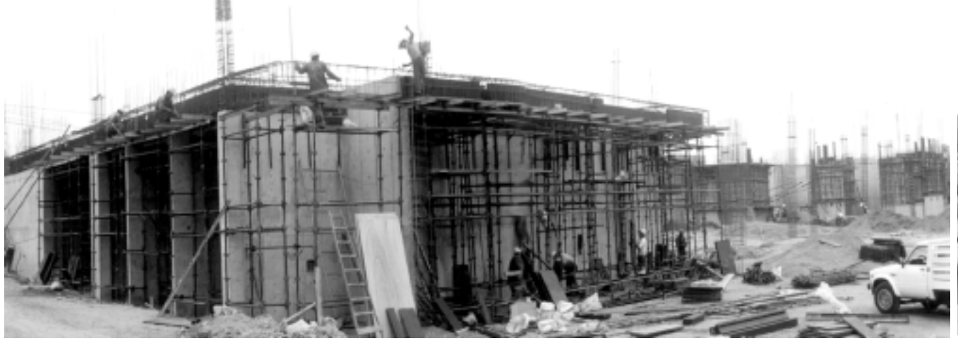
Modernas técnicas de construcción se vienen aplicando en los trabajos, por parte de la experimentada constructora Remanso SAC.