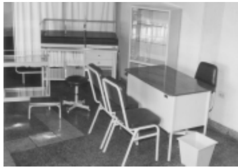
Juego de consultorio médico pediátrico de 10 piezas. Colores: blanco humo, beige, marfil, verde clínico y gris.