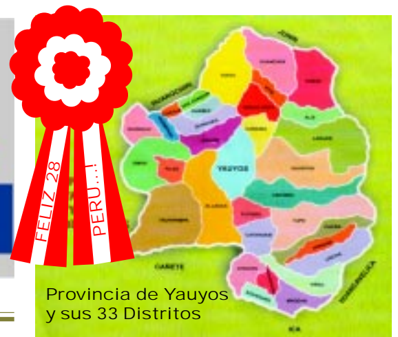
Provincia de Yauyos y sus 33 Distritos