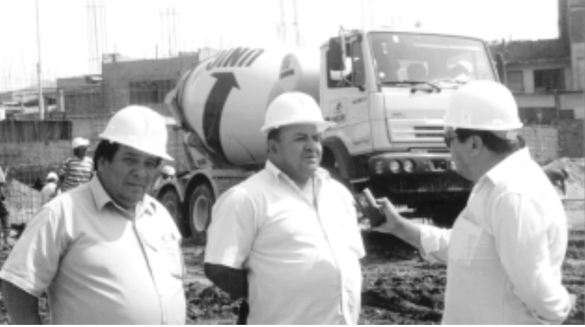
Arriba: Impresionante panorama de las obras, que es un orgullo para VMT y el cooperativismo. A la izquierda: PRENSA NACIONAL entrevista al Presidente.

La concepción, diseño y ejecución del Mercado de Villa María del Triunfo ha significado para la Constructora Remanso SAC el desafío de levantar sobre toda una gran manzana una construcción sólida, segura, funcional y de líneas modernas.