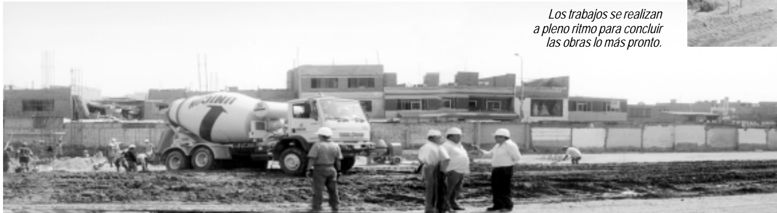
Los trabajos se realizan a pleno ritmo para concluir las obras lo más pronto.