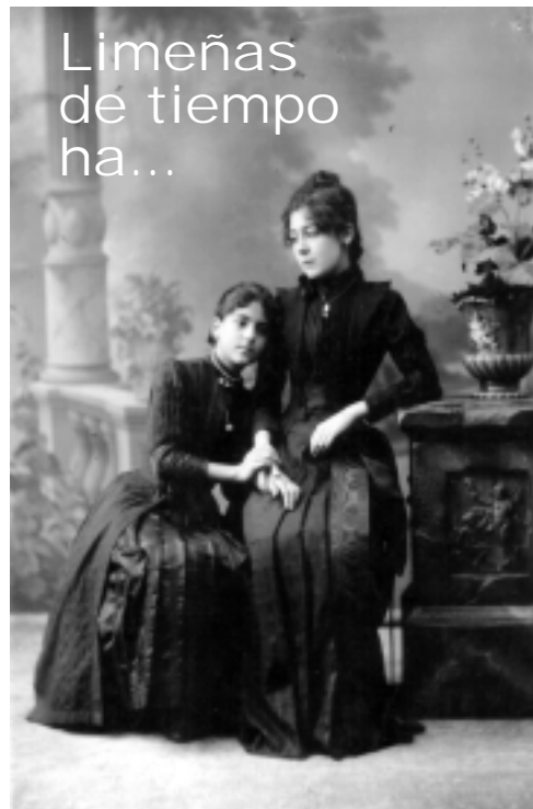
FOTO HISTÓRICA: Damas limeñas de 1887 luciendo el último grito de la moda. Pronto, un especial sobre evolución del vestido.

La amenaza del SIDA en el Perú es como una mancha de aceite que se expande sobre la superficie de aguas claras. Mientras se expande mata todo, asfixia todo, y genera mucho dolor, desencanto y repudio.