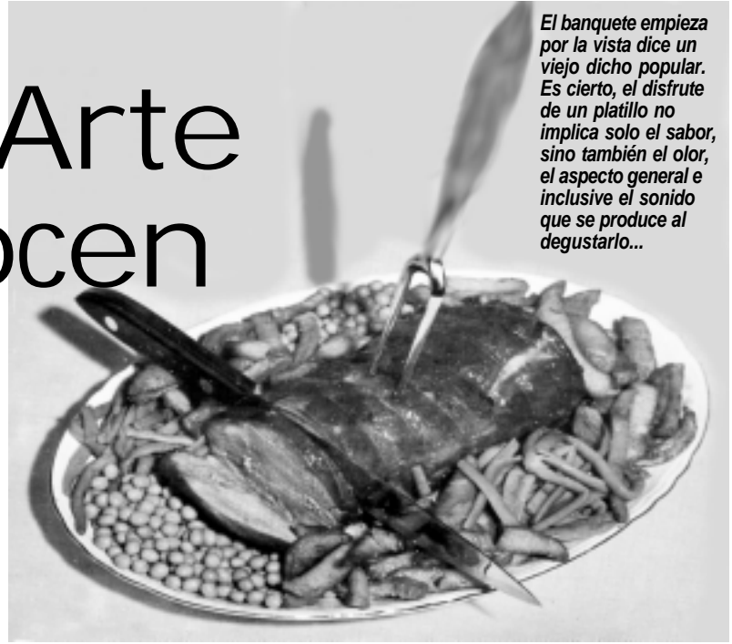
El banquete empieza por la vista dice un viejo dicho popular. Es cierto, el disfrute de un platillo no implica solo el sabor, sino también el olor, el aspecto general e inclusive el sonido que se produce al degustarlo...

En esta página encontraremos en cada edición consejos y respuestas para las preguntas relacionadas con una buena nutrición, con elementos que están al alcance de nuestras manos (y ollas) en los mercados, pero que no compramos porque no sabemos como utilizarlos. Las invitamos pues a conocer cómo mejorar los hábitos alimenticios de la familia, y aprovechar todo lo bueno y saludable que nos ha dado la Viña del Señor.