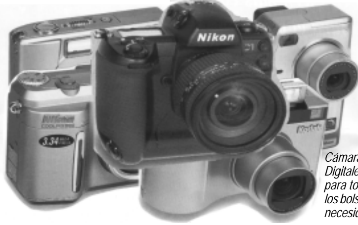
Cámaras Digitales para todos los bolsillos y necesidades

En futuras ediciones daremos mayor información sobre cámaras digitales.