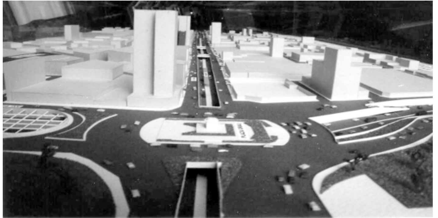
Perspectiva de la Avenida Grau vista desde la Plaza Grau hacia las avenidas Iquitos y Abancay, cuyos puentes se distinguen claramente.

Igualmente, está prevista la construcción de una nueva rampa de ingreso a la Vía Expresa de 380