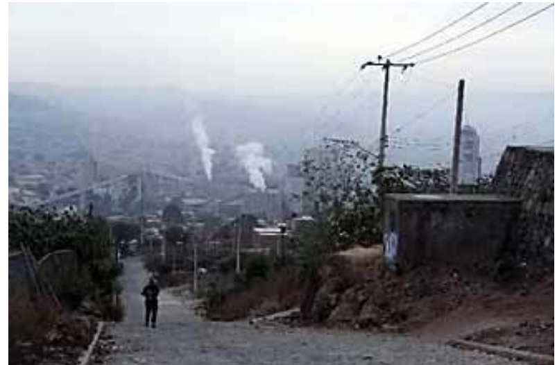
Guadalajara Jalisco, 2005

Los niveles ambientales normales son las concentraciones a las cuales se encuentran las sustancias en la atmósfera. El aire está compuesto principalmente por nitrógeno, oxígeno y gases nobles.