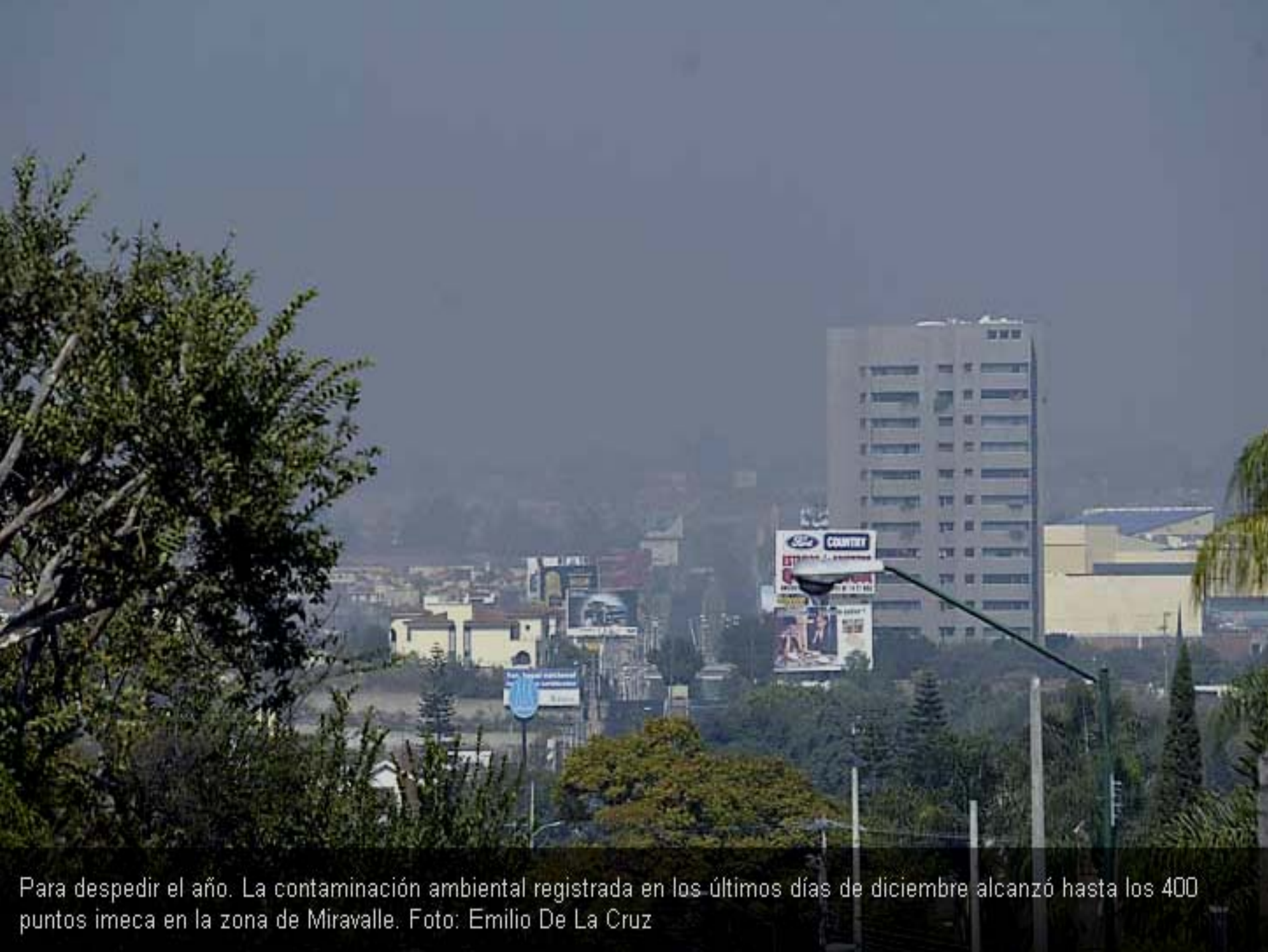
Para despedir el año. La contaminación ambiental registrada en los últimos días de diciembre alcanzó hasta los 400 puntos imeca en la zona de Miravalle.