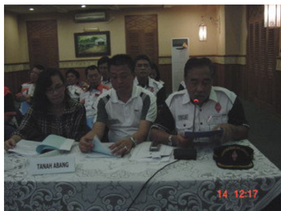
YBOFMO membacakan Laporan pertanggung-jawaban Pengurus Lokal Tanah Abang masa bakti 2005 – 2008.