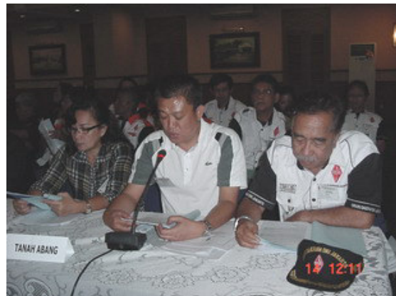
YD0EMR memberikan Laporan DPP masa bakti 2005 – 2008 mewakili Ketua DPP.

Berikut foto-foto saat MUSLOK bersama dilangsungkan.