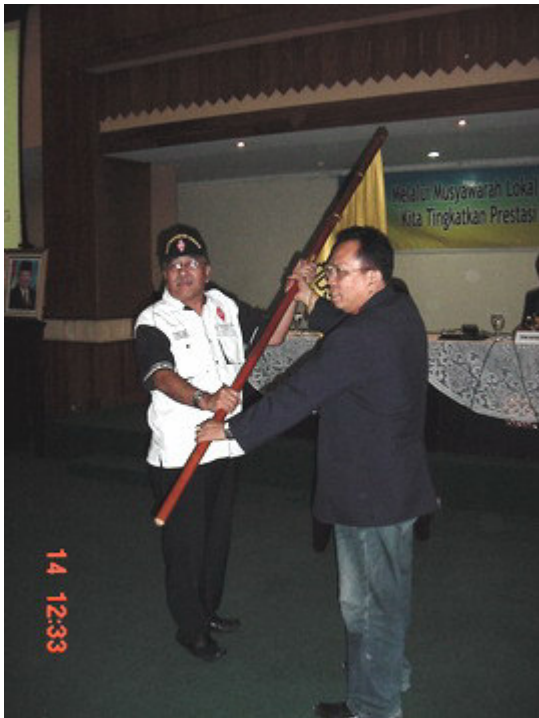
Penyerahan Duaja Lokal Tanah Abang oleh YB0FMO ke YB0MEU.