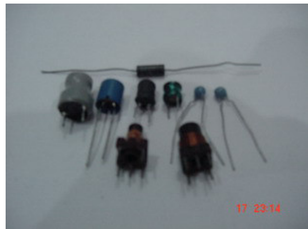
Inductor macam-macam ukuran

Berikut foto saat Penulis mengukur suatu Inductor.