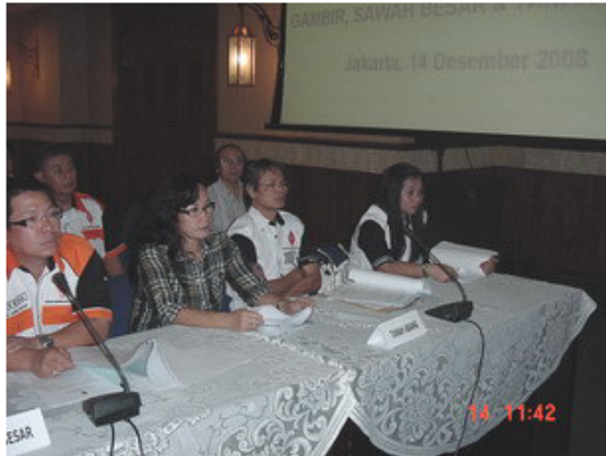
Sebagian Pengurus Lokal Tanah Abang