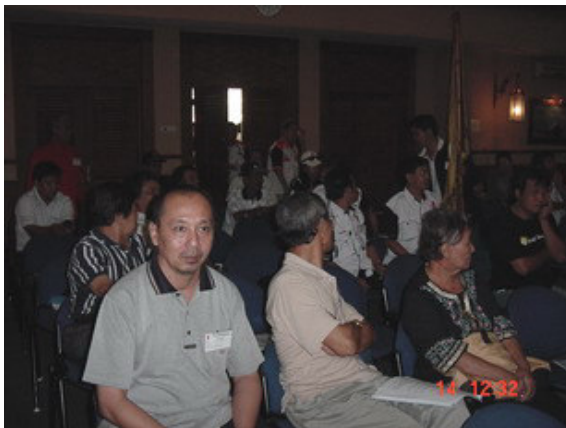
Anggota Lokal Tanah Abang yang hadir di Muslok bersama.