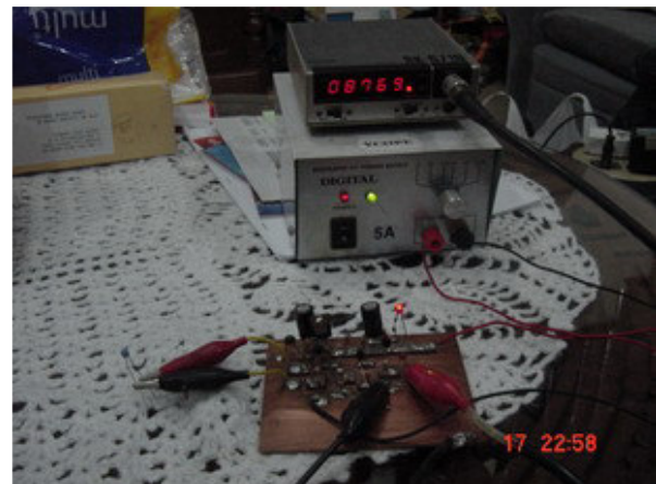
Pengukuran Inductor dengan bantuan Frequency Counter.

Pada foto diatas terlihat sebuah Power Supply untuk memberikan catu daya pada rangkaian, kemudian ditengah atas terlihat sebuah Frequency Counter dan dibagian depan bawah adalah rangkaian Simple Inductance Meter.