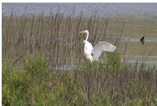
Agró blanc

Agró blanc Casmedorius albus : Un exemplar el dia 21 (XRCA, LLXA).