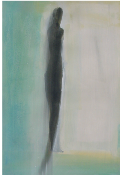
UNA LUZ (1, 2, 3 y 4). 2001. Tinta y acrílico sobre papel. 72 x 110 cm.