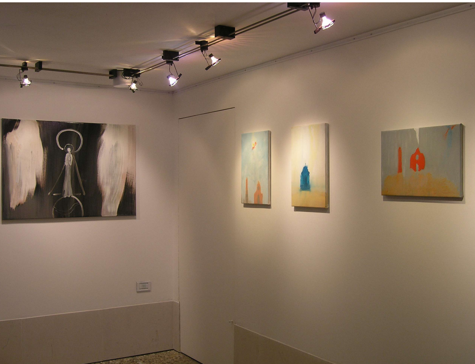
VIRGEN DE LOS LLANOS. Óleo sobre lienzo. 100 x 70 cm. ASSUNTA (1, 2 y 3). Óleo sobre lienzo. 30 x 45 cm.