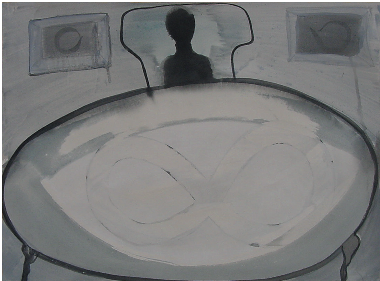
LAS MESAS. 2003. Tinta y acrílico sobre papel. 73 x 62 cm.