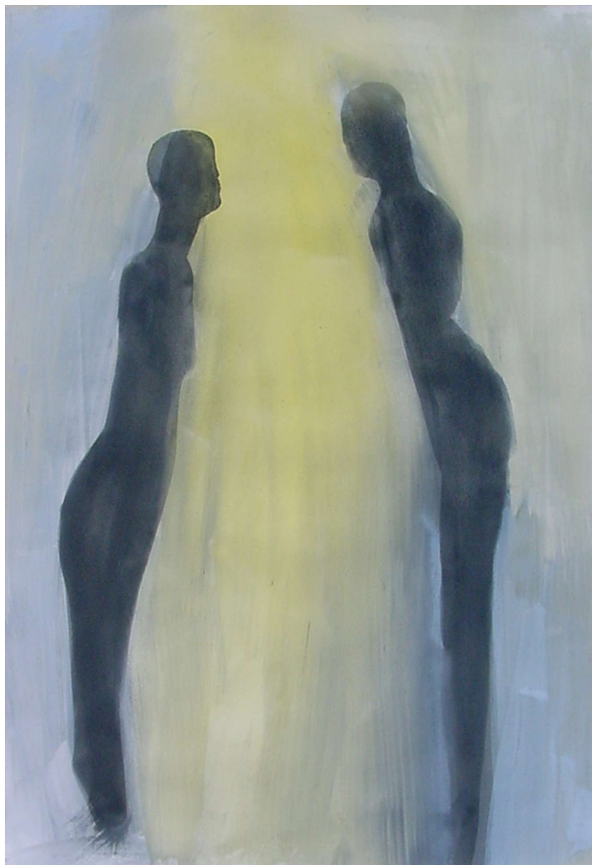
UNA LUZ. 2001. Tinta y acrílico sobre papel. 72 x 110 cm.