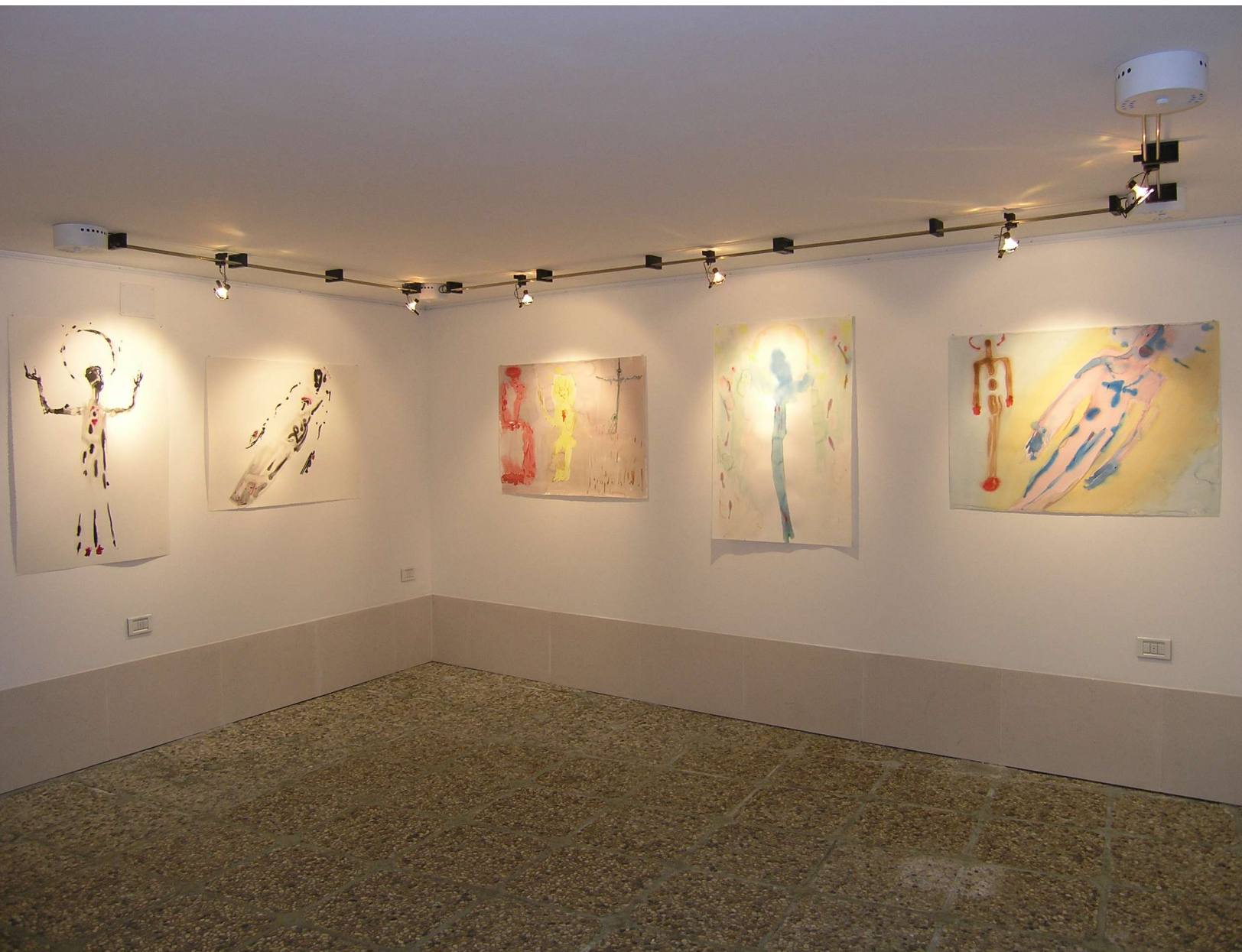
L' ASSUNTA ED IL CHRISTO (1, 2, 3, 4 y 5). 2004. Acuarela sobre papel. 100 x 70 cm.