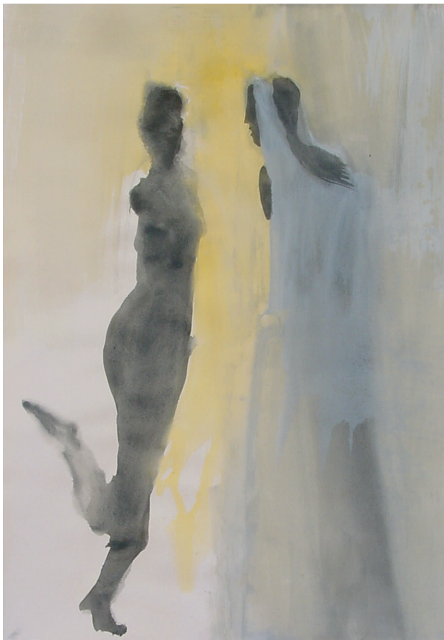
UNA LUZ. 2001. Tinta y acrílico sobre papel. 72 x 110 cm.