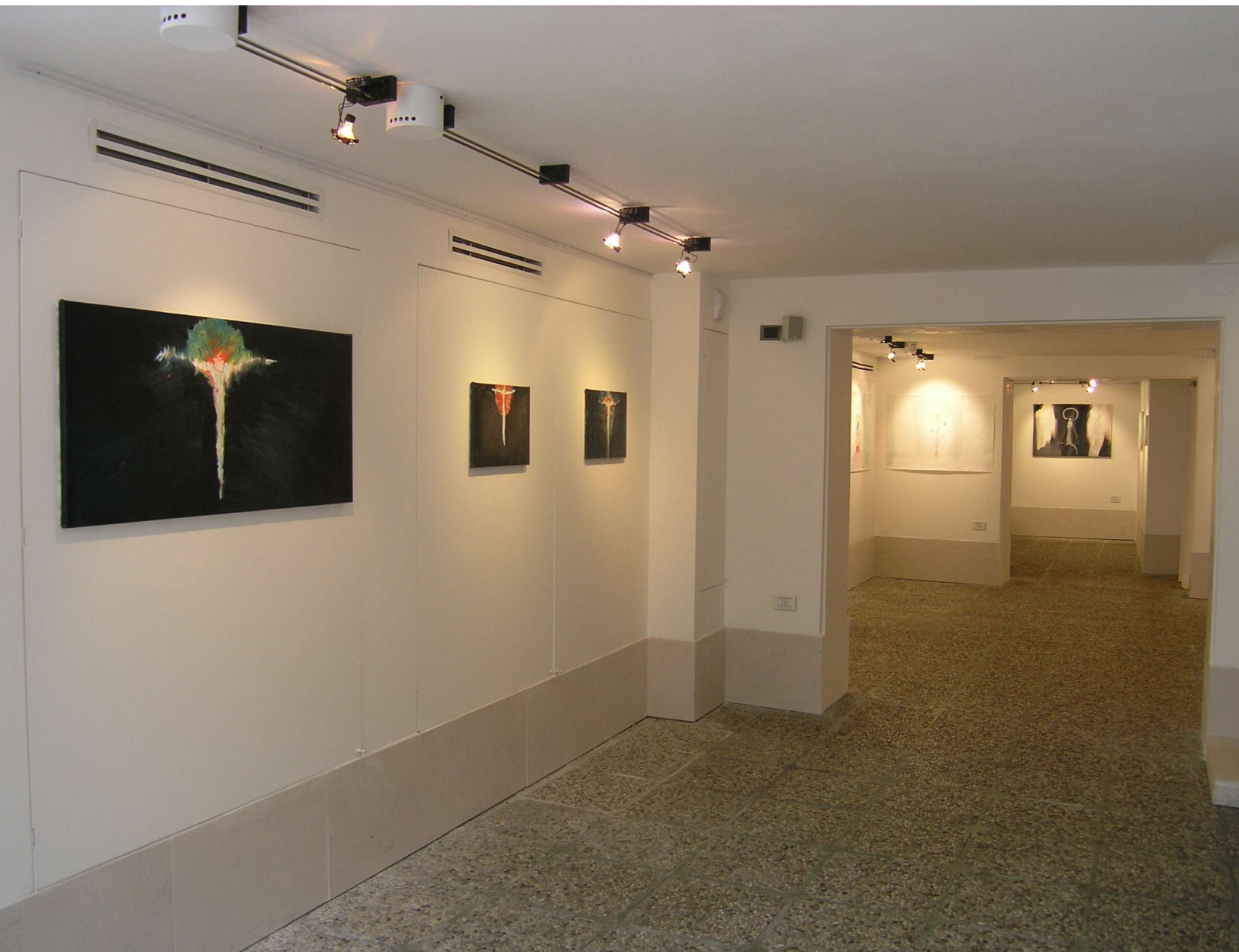
L' ASSUNTA ED IL CHRISTO (1 y 2). 2004. Bugno Art Gallery. Venecia.