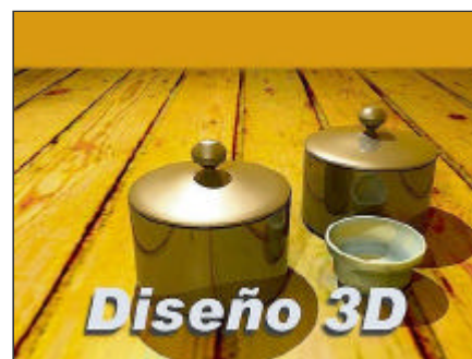
Título a ñadido al gráfico