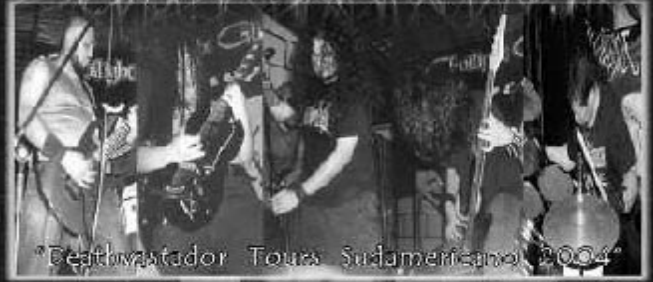
"Deathvastador Tours Sudamericano 2004"

DRH METAL PRODUCCIONES ESPIRITU PRODUCCIONES UN LAMENTO EN LA OSCURIDAD XV A LA REVELACION DEL DEATH METAL COLOMBIANO PRESENTANDOC SU 2004 CON UNO DE LOS MAS GRANDES PLATEWORKERS RECORDS