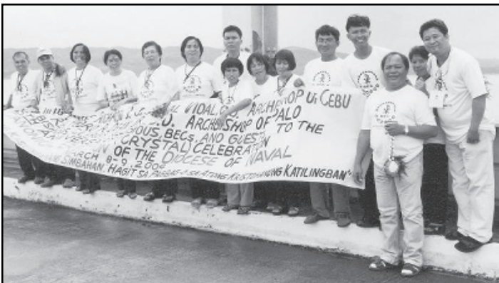
Malipayon ug mahinamong nagpaabot didto sa Biliran bridge ang PFT sa pag-abot sa mga bisita atol sa pagsaulog sa ika-15 nga anibersaryo (Crystal Anniversary) sa pagkatukod sa Diocesis sa Naval.

Busa unsa may kasulbaran niini? Unsaon nato pagpugong sa pagpaninguha sa kaugalingong kaayohan ug sa garbo aron malikayan ta ang dagkong katalagman? Kinahangalan dawaton ta ang "kaalam nga gikan sa langit," ang kaalam nga "putli, ug unya makigdaiton, maaghop, mahigalaon, maluluy-on ug maayong binuhatan" (San.3:17). Kana ang timailhan sa pagpatigbabaw sa kahusayan – ug pagsalikway sa kasamok.#