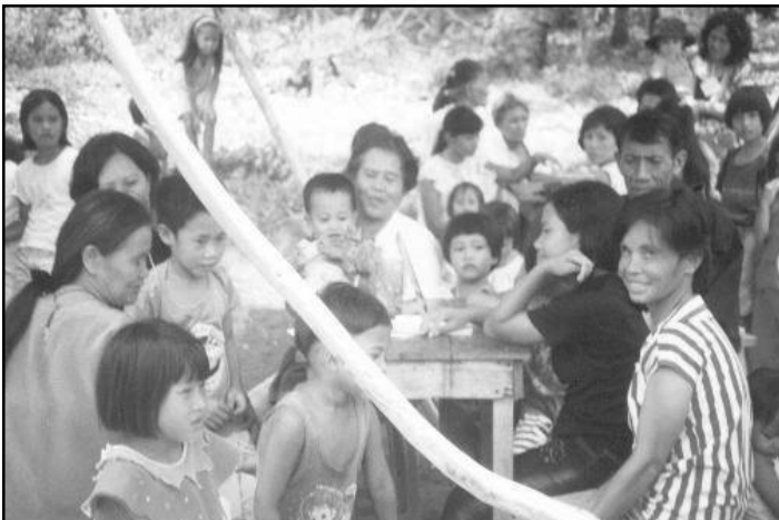
Katilingbang malipayon, katilingbang matahom: Ang BEC sa sityo Rosales diha sa ilang pagtuon sa senimanang bulohaton nga "prayer session".

Unsa man ang pagkakristiyanos alang kanimo? Usa ba kini ka klase sa kinabuhi nga pulos lamang pagtuman sa Balaud, nga kung matuman nimo ang mga balaud mahatagan na ikaw sa kaluwasan? O ang pagkakristiyanos usa ba ka klase sa kinabuhi sa paghigugma subay sa kinabuhi ni Kristo diin ang mga balaud giya lamang alang sa pag-angkon sa kinabuhing mahigugmaon?