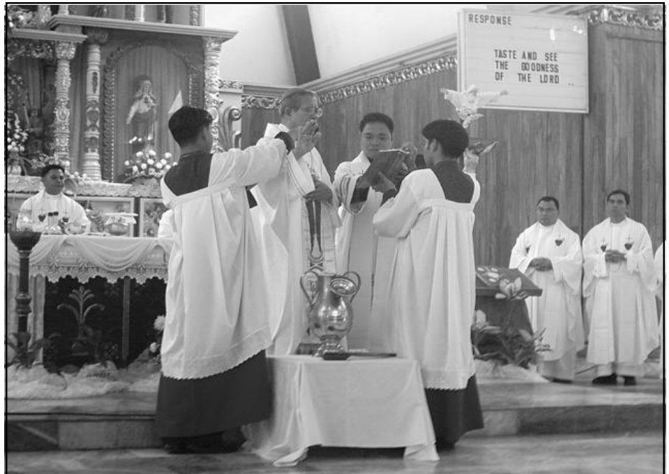
Gisaulog sa Diocese sa Naval ang ika 17th nga Anibersaryo niadtong milabay nga Marso 8, 2006 diin pormal usab nga gipasabot ang bag-ong parish assignments sa mga kaparian.

Kining mosunod mao ang mga BECs nga naghimo sa re-orientation: Sabang, Sto. Nino, Hospital Drive, Villa Caneja, Libtong, ug Riverside. Ang uban magahimo sa ilang re-orientation sa umaabot nga mga adlaw.