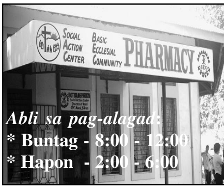
Gikan sa pahina 3