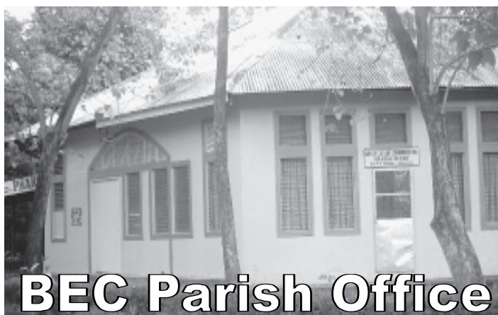
BEC Parish Office