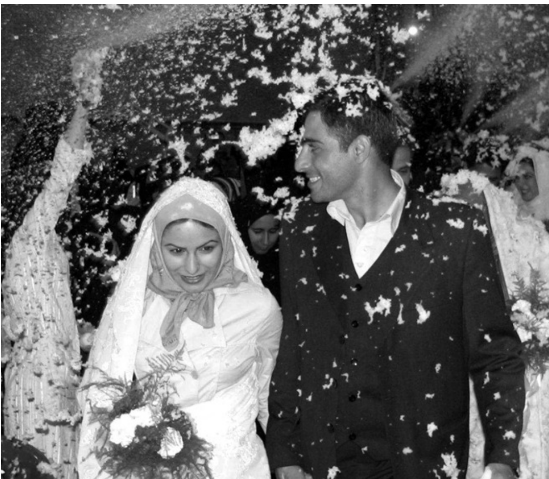
تیننه‌گيشتنی نیوان ژن ومیرد ونه‌بونی خوشه‌ويستی ، دواجار ته‌لاقی لیده‌که‌ويتته‌وه

که‌هاتنه‌ته دادگا تیننه‌گيشتنی نیوان ژن ومیرد ونه‌بونی متمانه و ریزو خوشه‌ويستی بووه .