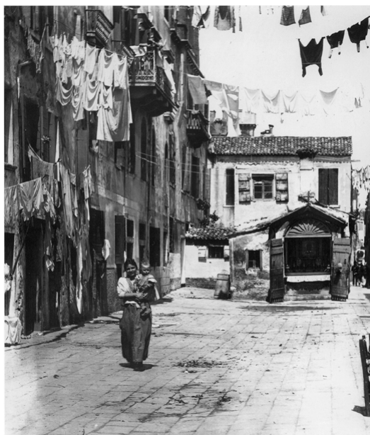
Ca' Sarasina vers 1880

Casarin - [23] 18. J'ai la sensation pendant que je commente, que je suis en train de les commenter avec un mélange d'instinct et de rationalité, qui semblent être équivalents. Quoi qu'il en soit, celle-ci m'évoque une Venise populaire qui vit sa phase de décomposition décadente [ rires ]... C'est-à-dire que je vois quelques signes, quelques symboles de la popularité des quartiers, comme par exemple les plus communs: telle la lessive pendue à l'extérieur. Je ne vois pas, par exemple, la vie populaire de la rue que l'on peut encore voir dans les photos d'archives de la fin du 19 ème siècle et aussi du début du 20 ème siècle, c'est pourquoi je parlais de populaire en décomposition.