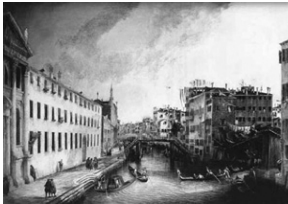
Le Rio dei Mendicanti, Canaletto 1724-1726

Semi - [279] Avec la numéro 6, où arrivons-nous ? Nous arrivons sur un canal qui croise le rio dei Mendicanti [ le canal des Mendicants ], et qui nous montre une image que l'on retrouve presque identique à un tableau de Canaletto. Si l'on ôtait ce pont métallique qui a été construit au temps de l'Autriche, et un bateau à moteur, le tableau de Canaletto serait absolument identique. Chose assez singulière !