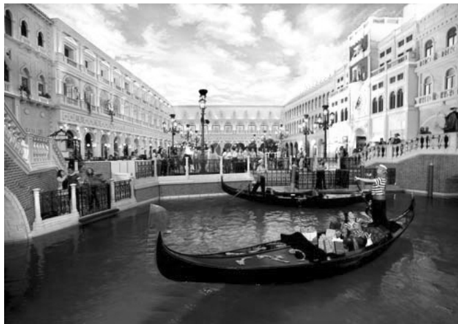
The Venetian Resort Hotel Casino, Las Vegas

J'aime beaucoup cette image: elle représente pour moi le côté parc d'attraction de Venise. La publicité pour un magasin d'habillement avec cette jeune femme déhanchée, le marchand de souvenirs à ses pieds, les gens qui sont arrêtés sur le pont, la gondole et ses passagers d'âge moyen assez élevé, le décor de la station de gondoles avec ces lanternes qui semblent sorties d'un conte des mille-et-une nuits, tout ici sent la consommation. On peut penser que c'est ce type de scénographie qui a servi de modèle à l'hôtel The Venetian de Las Vegas.