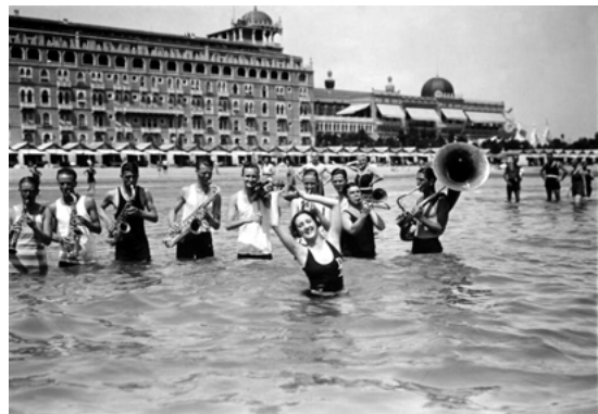
Vacanciers devant l'hôtel Excelsior au Lido de Venise, dans les années 1920

La période faste du Lido se déroule durant l'entre-deux-guerres: la qualité des hôtels et des services qu'ils offrent constitue une attraction importante pour une riche clientèle internationale, qui s'y rend pour y passer les traditionnelles longues vacances à la mer. La proximité de Venise, avec ses monuments, ses collections de peinture, ses soirées fastueuses, n'est certes pas étrangère à ce succès. En 1938, les présences touristiques s'élèvent, sur l'île d'or, à 519'000 nuitées 100 , mais le second conflit mondial freine brutalement sa fréquentation.