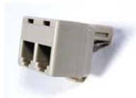
(4) Clavija extensora