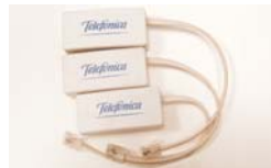
(3) Tres microfiltros