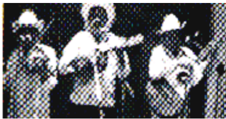
Figura 2: el grupo San Nicolás, de Jalpan del fonograma Antología del son en Querétaro I (2000)

Las posiciones que tienen los integrantes de la agrupación de la videograbación ya referida, y la del grupo San Nicolás de Jalpan, que se mira en la foto de la figura dos, son muy parecidas a las de la anterior ilustración, excepto que el jaranero está en la posición que ocuparía el guitarrero, además de que en esta foto omitieron al violinista segundo.