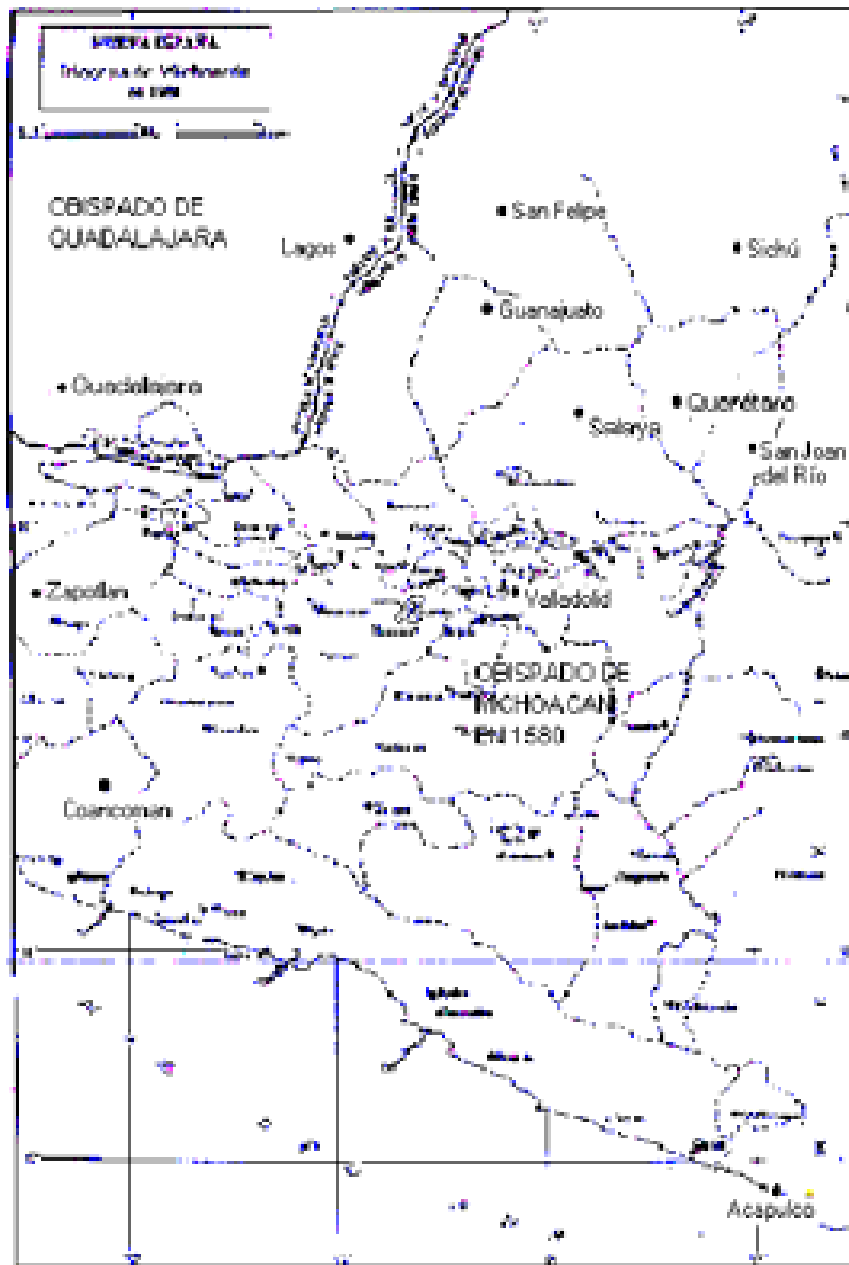
Mapa 6. Obispado de Michoacán en el siglo XVI, según René Acuña (1987), sin número de página.