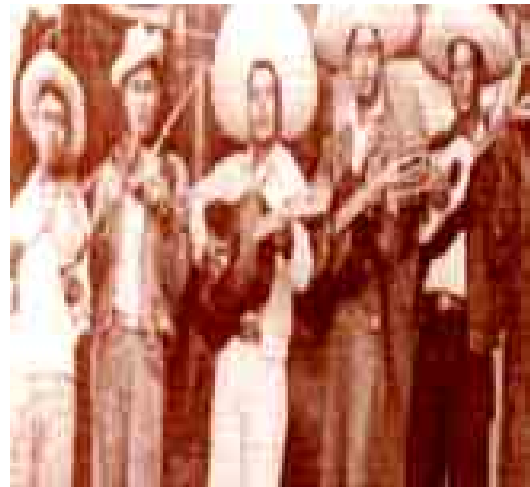
Figura 6. El grupo de J. Asención Aguilar, portada de Poeta con destino de Guillermo Velázquez (2000a).