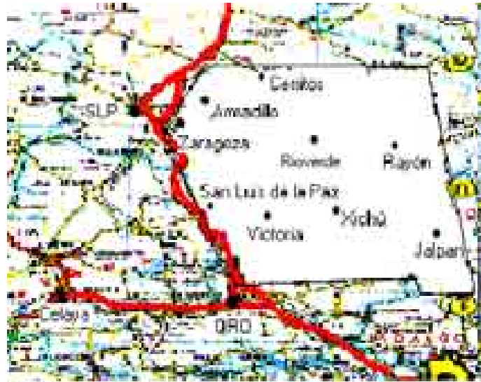
Mapa 1. Región donde se extiende la tradición.

Socorro Perea (1989: 25-27) y Vicente Osorio (1993: 9). Zaragoza y Armadillo se ubican dentro del Altiplano de San Luis Potosí (Monroy, 1999: 17-19). Cerritos, Rioverde y Rayón se encuentran en la Región Media del mismo estado (Monroy, 1999: 21), la cual se conoce más comúnmente como la Zona Media (Velázquez, 1993: 9, 2000a: 5). Jalpan, al norte de Querétaro, y Xichú, al noreste de Guanajuato, quedan dentro de la Sierra Gorda (García Ugarte, 1999: 24). San Luis de la Paz y Victoria se encuentran a orillas de dicha sierra, también en la porción nororiental de Guanajuato.