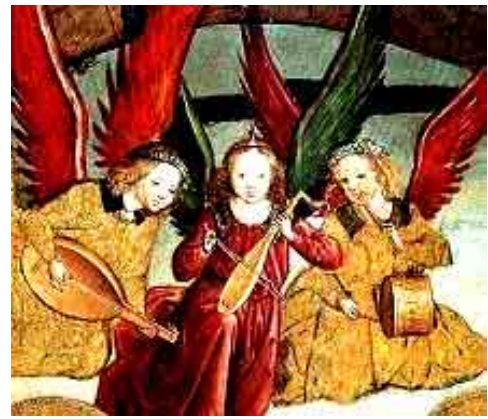
Figura 4. Pintura española de Pedro de Berruguete, siglo XV (Juan Ma Sánchez, 2001).