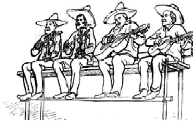
Figura 1. La música o agrupación musical para velaciones y huapango (Fernando Nava, S/F).

Las posiciones que tienen los integrantes de la agrupación de la videograbación ya referida, y la del grupo San Nicolás de Jalpan, que se mira en la foto de la figura dos, son muy parecidas a las de la anterior ilustración, excepto que el jaranero está en la posición que ocuparía el guitarrero, además de que en esta foto omitieron al violinista segundo.