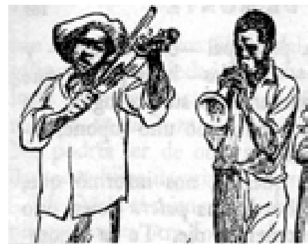
Figura 8. Dúo de la Costa Chica (Aguirre Beltrán, 1985: 164).