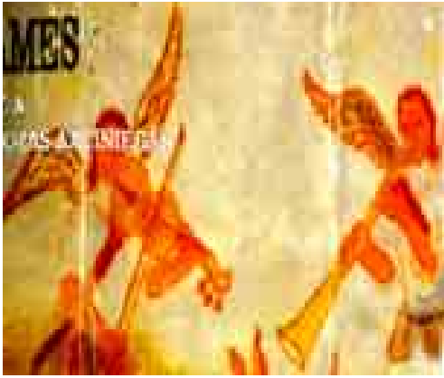
Figura 3. Pintura de la iglesia de San Miguel Tolimán.