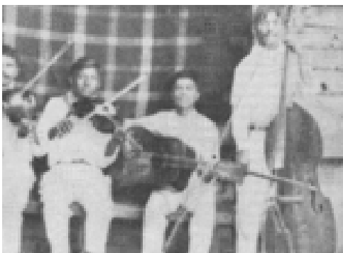
Figura 7. Mariache de Nayarit (Jáuregui, 2001)