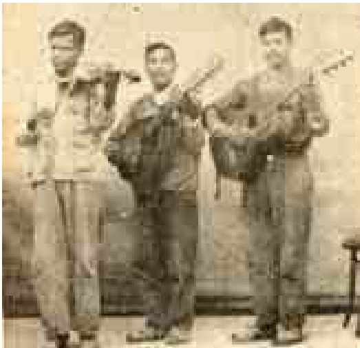
Figura 5. La foto del libro de Guerrero Tarquín (1988), sin número de página.