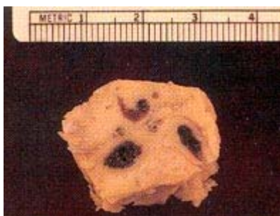
Eurytrema no pâncreas