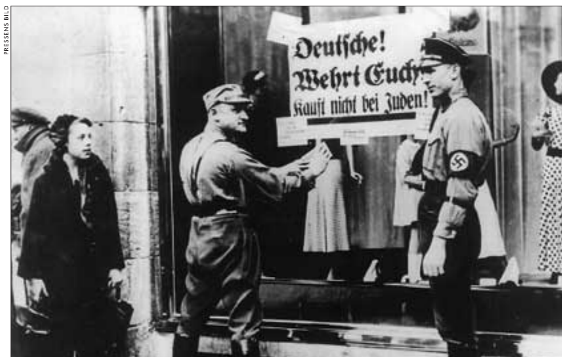
"Köp inte av judar" står det på plakaten som klistras upp av SA-männen. I dag är det 63 år sedan Kristallnatten.

– I närheten av min hemstad Nordhausen fanns det en gång ett koncentrationsläger där tusentals judar blev mördade. I dag lever inte en enda jude i Nordhausen. På platsen där det en gång stod en vacker synagoga, påminner endast en minnessten om denna onda tid. Direkt vid denna plats står en kyrka där de kristna brukade samlas. Och det kan de göra fortfarande till skillnad från judarna, sa denne tyske kyrkoledare.