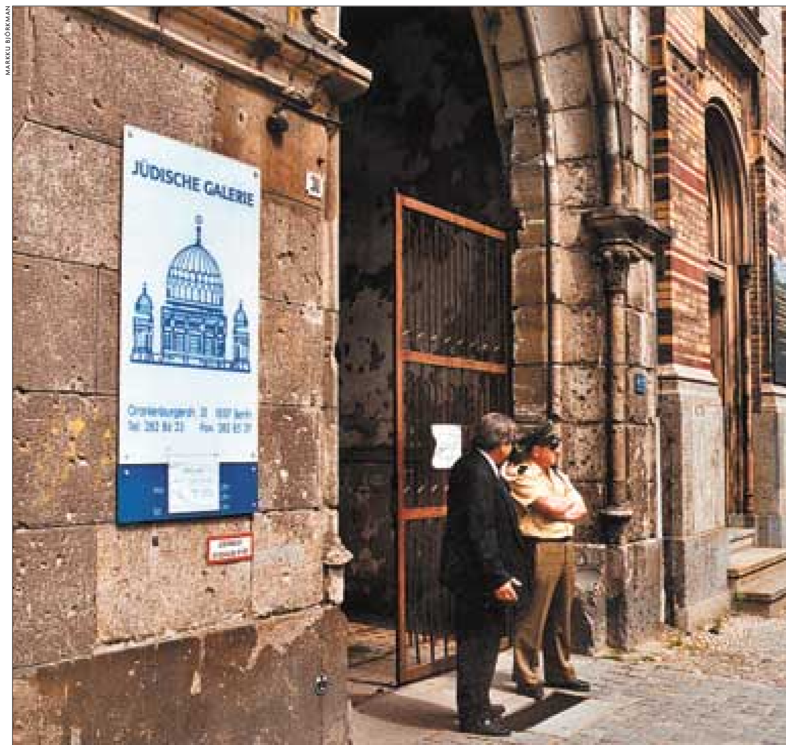
Beväpnade poliser patrullerar i dag framför synagogan och det judiska konstgalleriet vid Oranienburger Strasse. Efter den senaste tidens attentat mot synagogorna i Berlin, Düsseldorf och Mainz har man förstärkt bevakningen av judiska institutioner i Tyskland. Kulhålen i väggen runt galleriskylten härrör sig dock från gatustriderna under andra världskrigets slutskede.