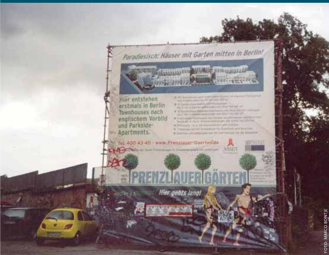
'Paradiesische' nieuwe woningen met tuin ontstaan in het project Prenzlauer Gärten.