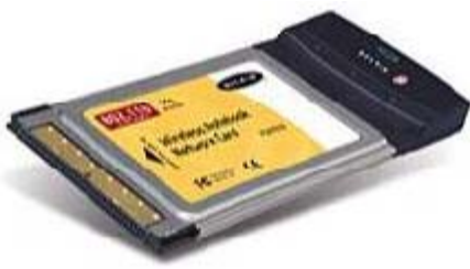
Internal WLAN PCMCIA

Sementara untuk notebook sendiri juga tersedia adapter wireless LAN yang menggunakan slot tipe PCMCIA. Pada kebanyakan notebook model terbaru bahkan adapter wireless-nya sudah terintegrasi di dalam chipset, yang sering kita dengar dengan istilah Centrino . Jadi pada notebook yang menggunakan teknologi Centrino tidak perlu menggunakan adapter tambahan lagi untuk berkomunikasi pada jaringan wireless.