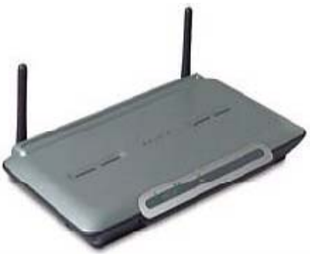
Access Point ( AP)

Dengan menggunakan Access Point dapat menghubungkan antara jaringan yang menggunakan kabel dan jaringan yang menggunakan perangkat wireless atau tanpa kabel. ( Seperti padagambar di halaman 1 ).