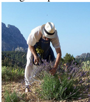
es el momento de iniciar la recolección de las flores