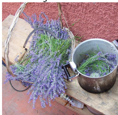
las flores recién segadas se introducen en la olla de destilación