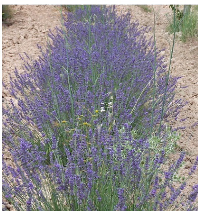
cuando la lavanda de Sirventa desprende su mejor aroma