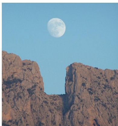
En la Luna llena de agosto que asoma por el Puig Campana