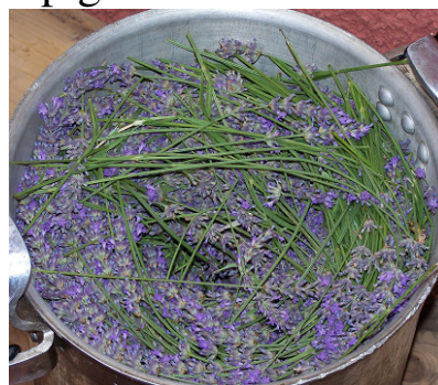
se añade agua de lluvia de Sirventa para destilar las plantas