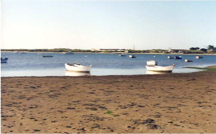
Barcas en El Rompido - Huelva