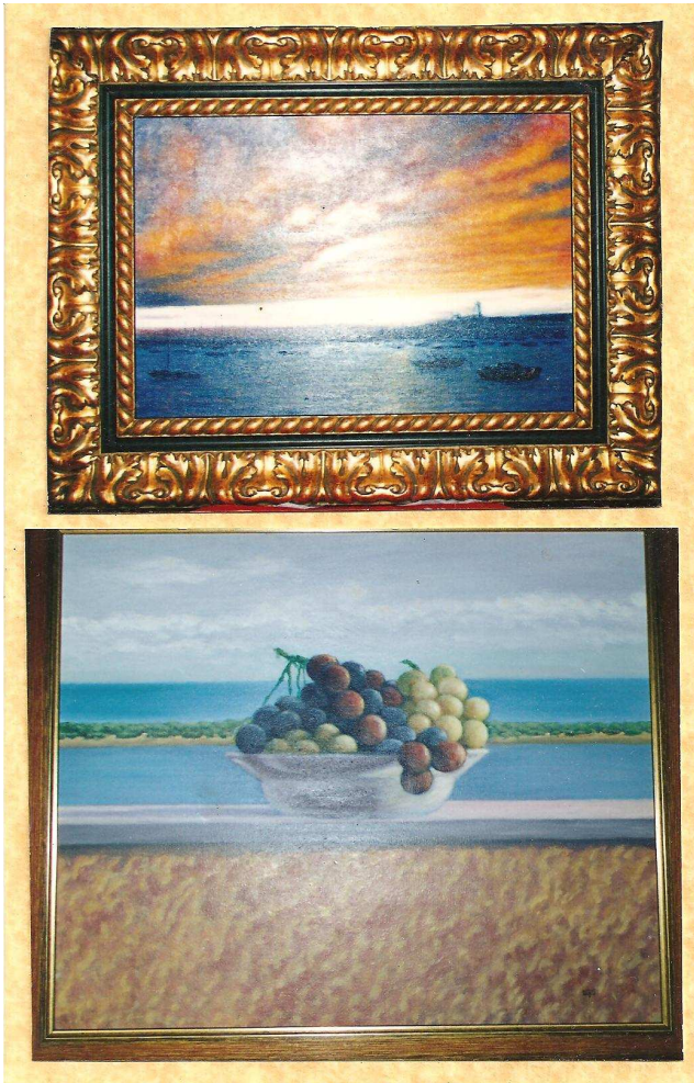
Bodegones – Luis Gómez