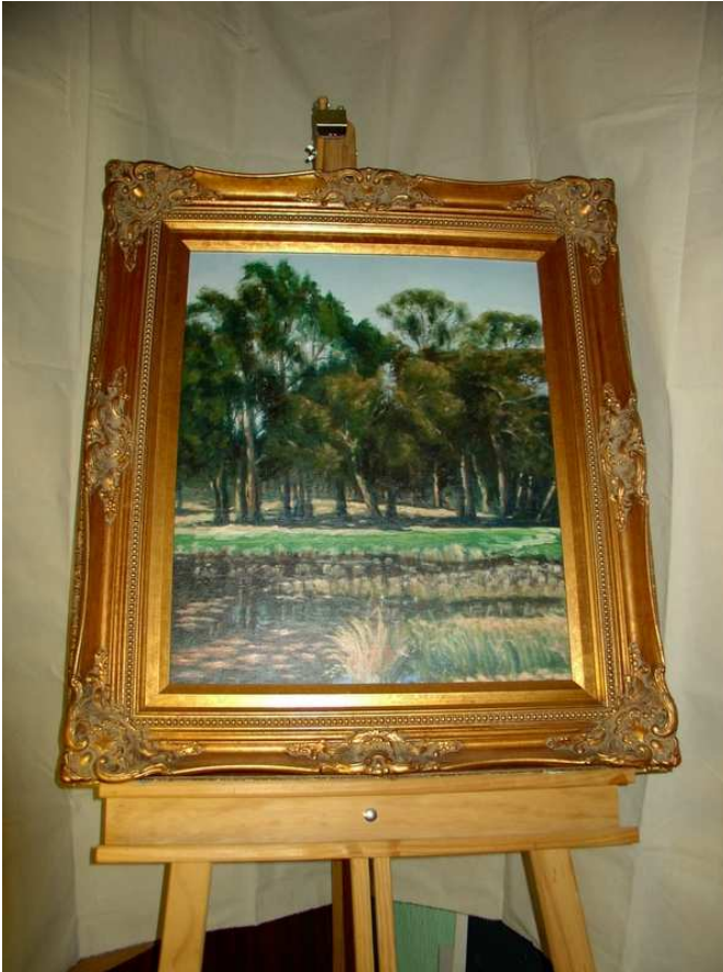
Paisaje al óleo – Luis Gómez

y es tu camino en victoria la razón de mi existencia; a ese verso inexorable que nunca sabré escribir, te comparo.