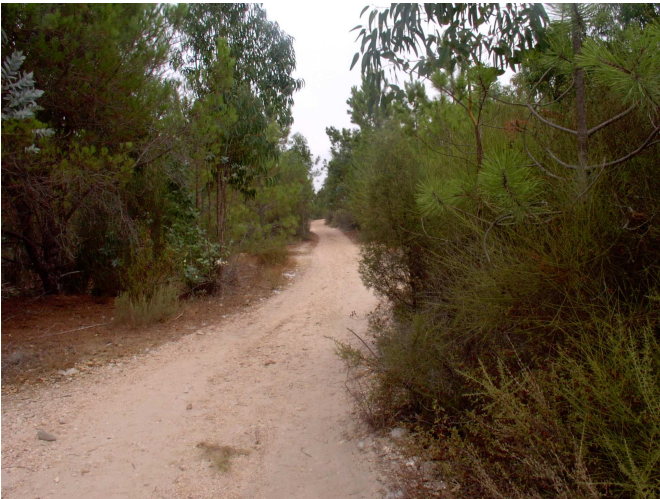
Campo – El Rompido - Huelva