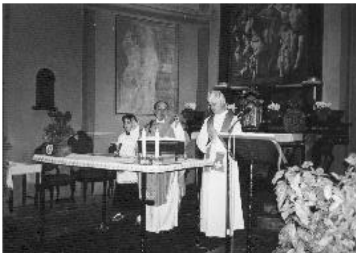
S.Messa a S.Croce

Dopo la Santa Messa con molti amici ci siamo incontrati al Crotto Quartino per un lauto pranzo. Una amicizia e una stima tra la comunitá e il missionario che continua negli anni e si rafforza. Grazie a tutti gli amici per l'apporto dato al nuovo progetto.