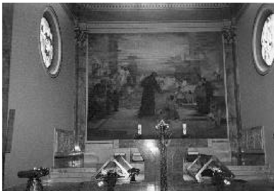
Altare dei Beati Luigi e Chiara

Si è raccomandato ai diversi gruppi di volontari di scrivere sul Bollettino tutte quelle piccole iniziative che si fanno, perché tutti possano conoscere un po' di più la vita e le iniziative dei vari gruppi in segno di comunione e di incoraggiamento