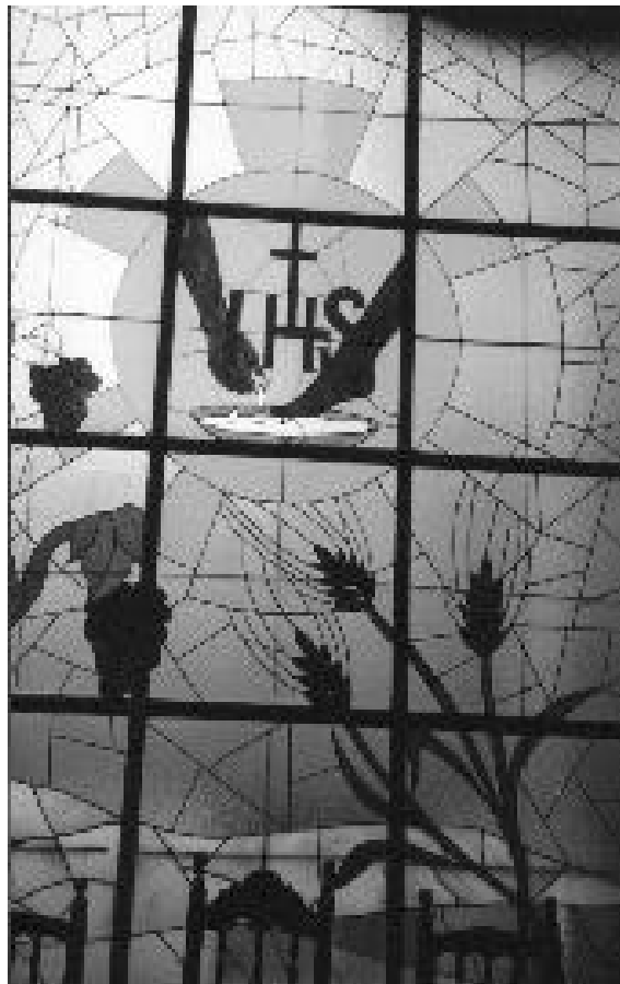
Parrocchia di Corpus Christi

Con la cara Congregazione e con voi, carissimi/e non ci sentiamo soli! Grazie di tutto cuore!