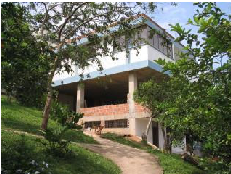
Il nuovo Seminario Guanelliano a Bucaramanga