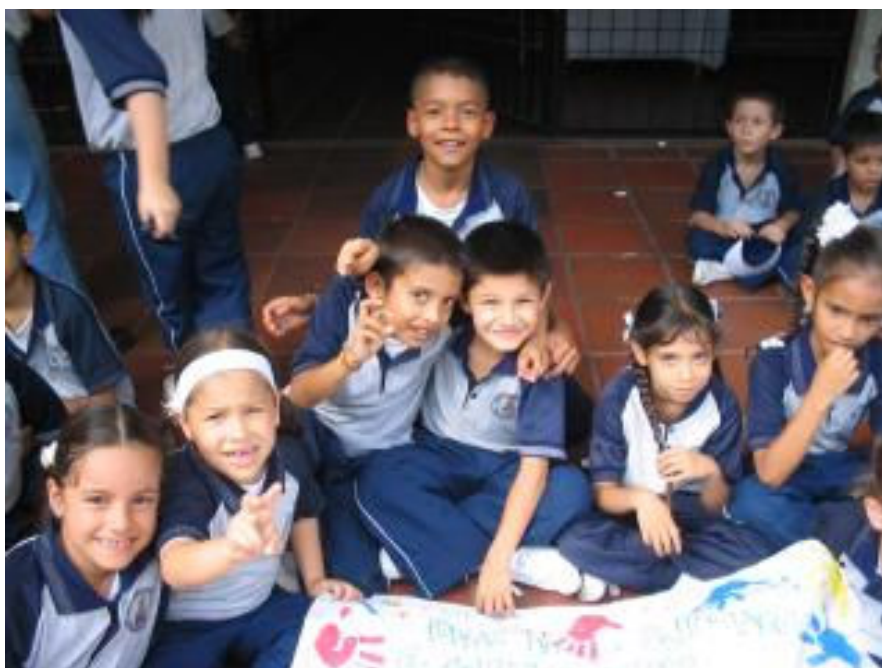
Bambini della scuola Parrocchiale S. Lucia.