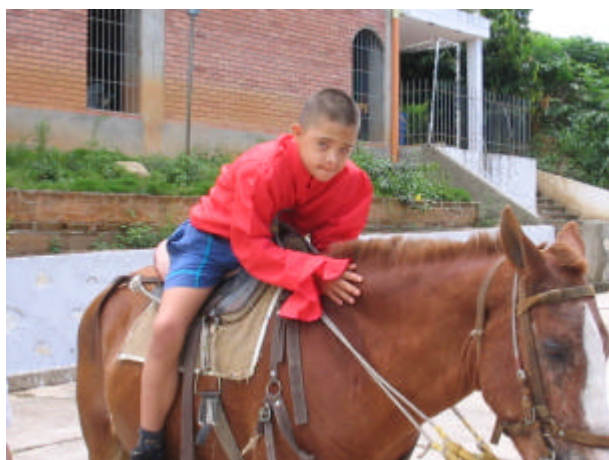
Ippoterapia per disabili