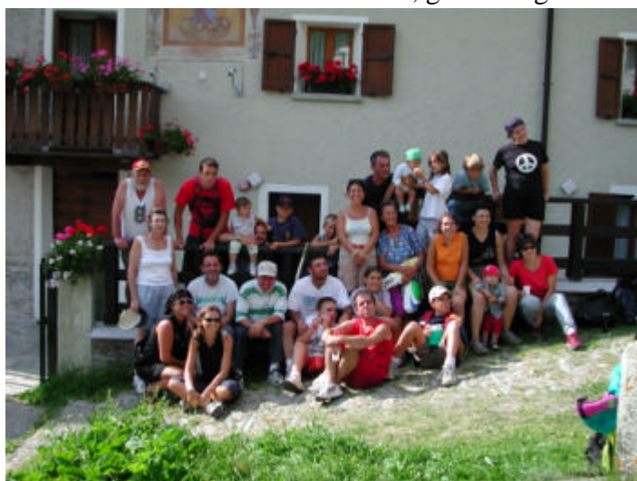
Il gruppo alla casa del Beato

Abbiamo potuto godere di un tempo meraviglioso che ci ha facilitato passeggiate ed escursioni anche ad alta quota, ammirando panorami mozzafiato, respirando aria pura e fresca di montagna, fraternizzando con la popolazione dei vari paesini e alpeggi, gustando i piatti tipici delle località montane e l'amicizia sincera, gioiosa e generosa di molte persone.