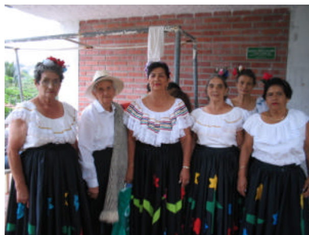
Anziani al "Techo" fraterno