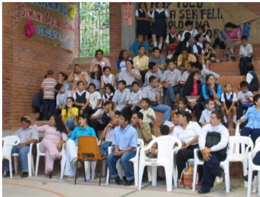
Salone del Centro Educativo per disabili in Colombia

E- mail: sdcsmt@prodigy.net.mx Tel: 00.52.55.26355569 (Dall'Italia)