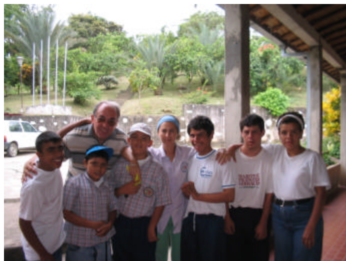
Padre Cosimo a Bucaramanga - Colombia

“ Allargare i confini ” vuol dire dunque che oltre alla Missione Guanelliana Messicana, si darà uno spazio maggiore, in questo Bollettino, alla Missione Guanelliana in Guatemala e si incomincerà a far conoscere anche la Missione Guanelliana in Colombia. Presenteremo, quindi, un po' alla volta, i diversi progetti di queste tre nazioni. Si apre ai Volontari la possibilità di fare volontariato anche in Colombia oltre che in Guatemala e Messico.