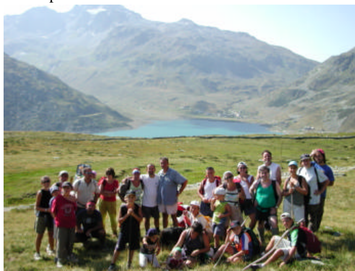
Il "cammino" e la "montagna"