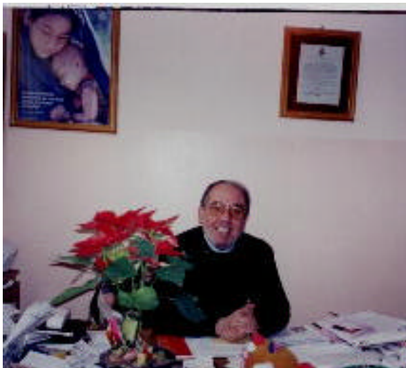
Un saluto da Don Cosimo!