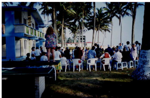
Gita al mare!