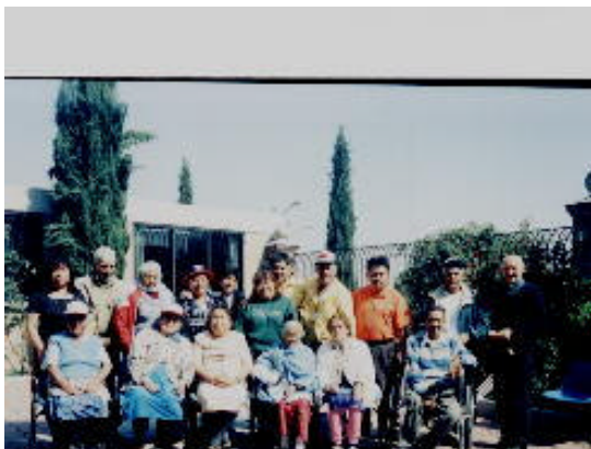
Foto di gruppo al Techo

Nella Colonia S. Miguel Teotongo, alla estrema periferia sud-est della Città del Messico dove i Sacerdoti Guanelliani hanno la loro missione, iniziava 14 anni fa la sua attività il “Tetto Fraterno” : una struttura originale destinata a sviluppare nel territorio circostante una cultura di promozione, di vita, di rispetto, di dignità e solidarietà verso le Persone della terza (e quarta) età. La Congregazione Servi della Carità - Opera Don Guanella - già da anni aveva iniziato in Cile queste attività del “Tetto Fraterno” molto originali e funzionali e di forte impatto nel territorio. Ascoltando la popolazione della colonia, visitando costantemente le case, facendo uno studio sulla situazione degli anziani in Messico e nelle zone periferiche, i sacerdoti guanelliani e i gruppi di laici impegnati nella evangelizzazione e nella promozione umana decisero di aprire, un “Tetto Fraterno” per dare attenzione alle persone anziane della zona, soprattutto a quelle sole, povere ed emarginate.