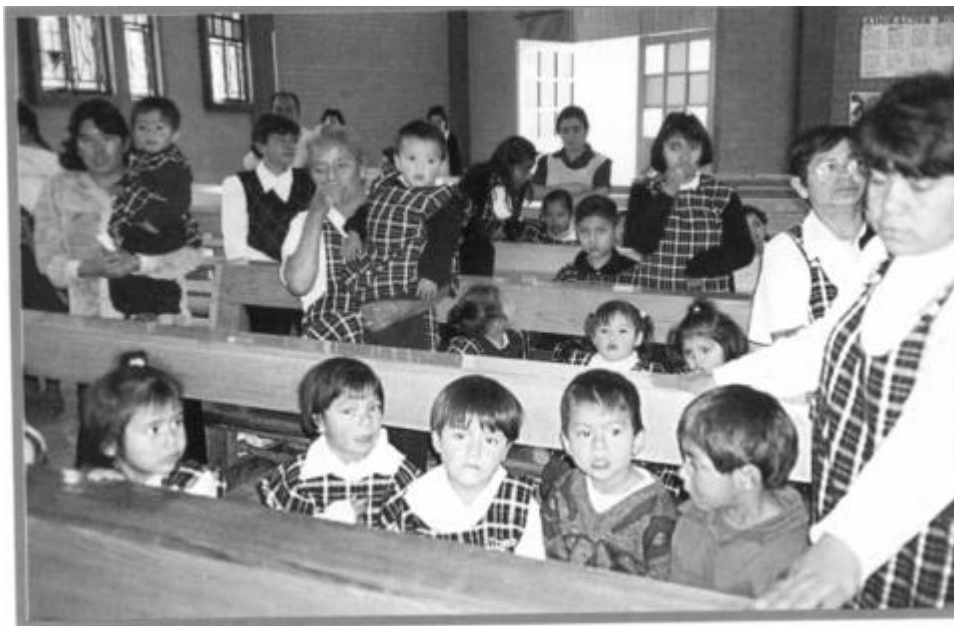
Bambini al "Centro Social"