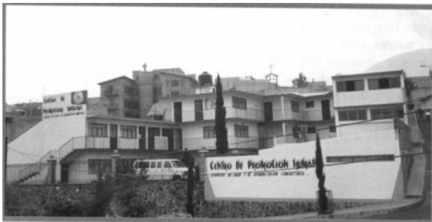
Centro di Promozione Umana – Sullo sfondo il seminario e la parrocchia