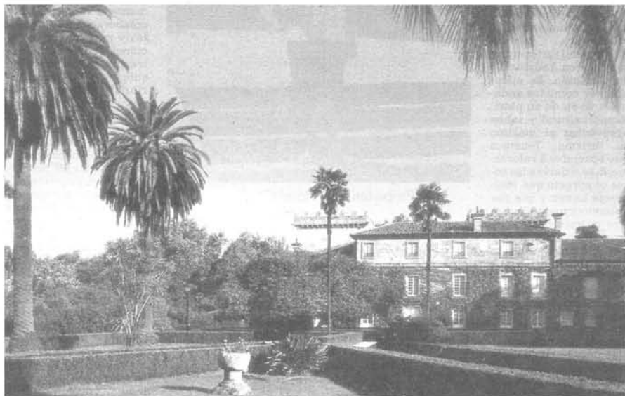
"El Museo Quiñones de León es uno de los monumentos más importantes a conservar de nuestra ciudad al igual que sus contenidos".

Dando una primera forma a estos principios fundamentales, la Carta de Atenas de 1931 ha contribuido al desarrollo de un vasto movimiento internacional, que se ha traducido principalmente en los documentos nacionales, en la actividad del ICOM y de la UNESCO y en la creación, por esta última, de un Centro internacional de estudios para la conservación de los bienes culturales. La sensibilidad y el espíritu crítico se han vertido sobre problemas cada vez más complejos y más útiles; también ha llegado el momento de volver a examinar los principios de la Carta a fin de profundizar en ellos y de ensanchar su contenido en un nuevo