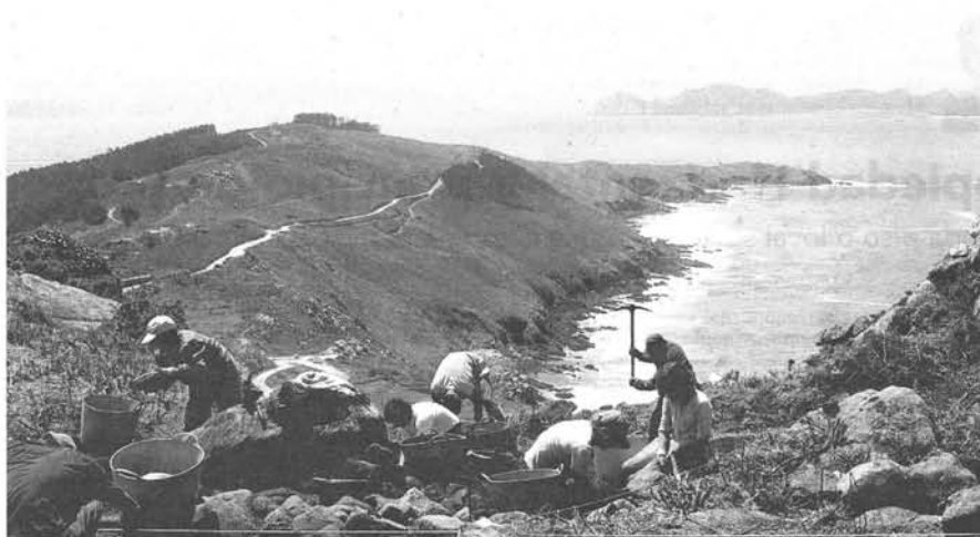
Los arqueólogos sostienen "que lo que no se publica no existe". Los trabajos de control arqueológico deberían ser publicados"

El mantenimiento de las ruinas y las medidas necesarias para la conservación y protección permanente de los elementos arquitectónicos y de los objetos descubiertos deben estar garantizados. Además, se emplearán todos los medios que faciliten la comprensión del monumento descu-