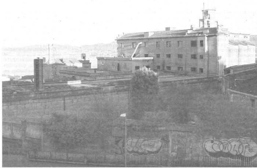
"El Turismo Cultural e Industrial se presenta como una alternativa para recuperar una parte de este Patrimonio y evitar así su desaparición."

Si bien tanto en la ley de Patrimonio Histórico Español, como en la "Ley de Patrimonio Cultural de Galicia", incluyen dentro de su protección los bienes de interés científico o técnico, al ver la alegría con la que sobre este patrimonio se maneja la piqueta no podemos menos que pensar si se actuaría con la misma ligereza si se tratara del taller de algún famoso artista en vez del lugar donde se han ganado la vida cientos de anónimos trabajadores. Por ello consideramos