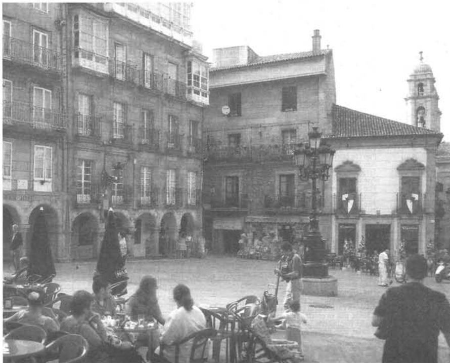
"Sería una buena iniciativa que las autoridades preparasen unas rutas culturales-gastronómicas para promocionar nuestra riqueza patrimonial."

De todos es conocida la ruta de la Ribera Sacra o la ribera del Sil, en la que se pueden visitar los monasterios de san Esteban de Ribas de Sil o Santa Cristina de Ribas de Sil, pero hay otros monasterios que no están tan promocionados y que vale la pena visitar como el de Santa María da Armenteira en el Valle del Sal-