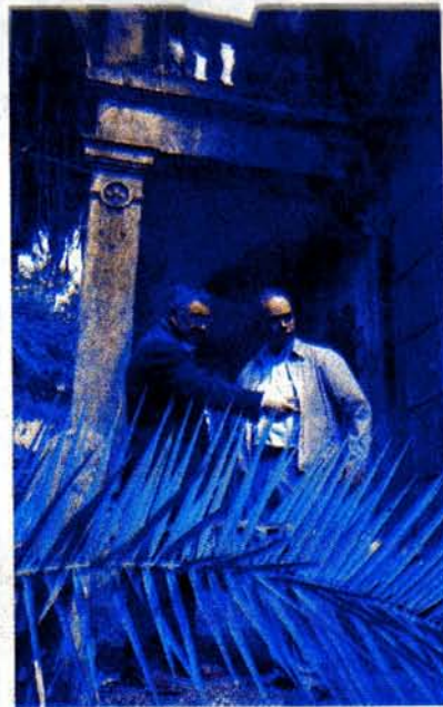
Estado actual del edificio (arriba), fachada Churruchaos y concejal y promotor en la finca.

gido por la arqueóloga María del Carmen Cabezedo, la obra a rehabilitar "es de gran valía incluso para el estudio de la arquitectura, de una belleza inusitada como se puede admirar en los exquisitos detalles de su decoración" y en base a ello los autores recomiendan, y así lo entiende y a ello se compromete el Concello de Poio, que es necesario conservar tan significativa edificación, en base a una serie de criterios de respeto a la arquitectura ori-