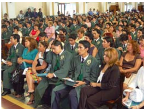
En la capilla, los Neo-Bachilleres estuvieron acompañados de sus respectivas madres.