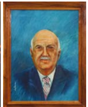
Retrato al óleo