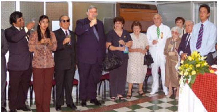
Directivos, condecorados y familiares durante el brindis.