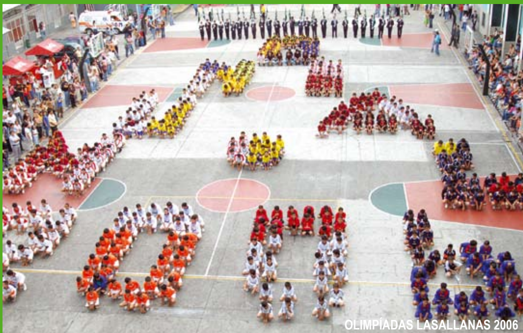
OLIMPIADAS LASALLANAS 2006