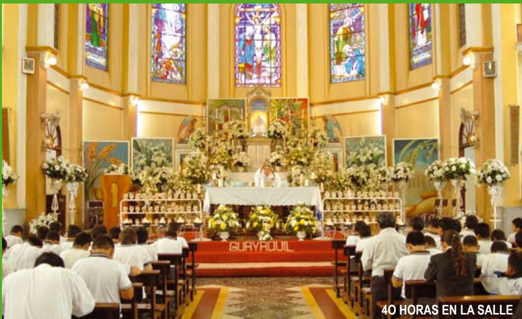
40 HORAS EN LA SALLE