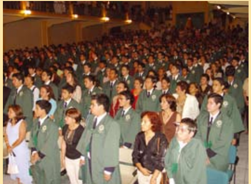
No hubo impedimentos para estar presentes al momento de recibir gloriosamente, el título de BACHILLER LASALLANO.