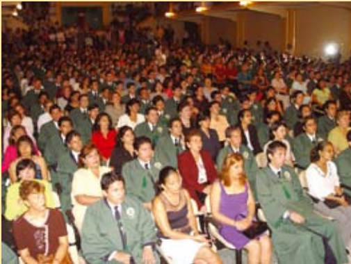
La mayor parte de los estudiantes, estuvo acompañado de su madre, a quien agradecieron haberlos ayudado en esta difícil tarea.