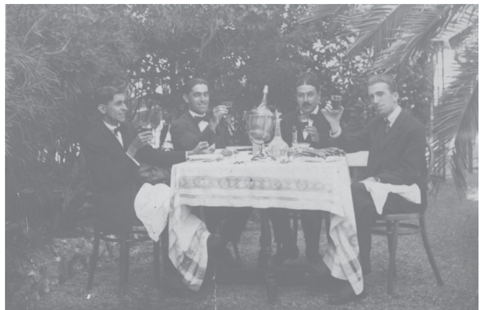
José Carlos Mariátegui alrededor de la mesa del Restaurant Campestre Il Piccolo Eden de la ciudad de Nervi (Genova)

nas y por ello clamará "No queremos, ciertamente, que el socialismo sea en América calco y copia. Debe ser creación heroica. Tenemos que dar vida, con nuestra propia realidad, en nuestro propio lenguaje, al socialismo in-