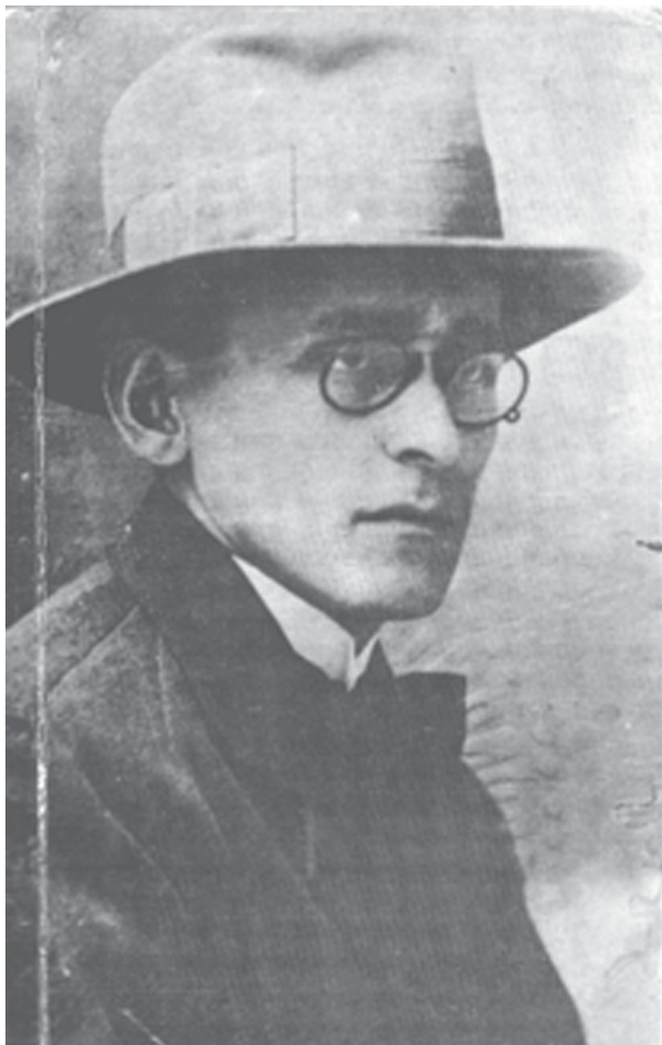
Foto de su credencial de prensa como corresponsal de El Tiempo en Italia - 1921

valores sociales, culturales, éticos, estéticos o religiosos precapitalistas y reconoce en él un amplio rango de variedades desde el conservador al revolucionario. Afirma que los propios Marx y Engels son parte de dicha tradición al concebir el comunismo moderno como el restablecimiento de ciertos rasgos de las comunidades primitivas, por supuesto que en las nuevas condiciones del desarrollo social y económico. En una carta de Marx a Vera Zasúlich, en 1881, se afirma que la abolición del capitalismo significará el regreso de las sociedades modernas al tipo "arcaico" de propiedad comunal, un renacimiento del tipo de sociedad arcaico bajo una forma superior. Lowy afirma que desde fines del siglo 19º hay dos tendencias en el marxismo: una es la corriente positivista y evolucionista de Plejanov, Kautsky, la 2ª y la 3ª internacionales bajo la hegemonía de Stalin, en la que se piensa al socialismo como continuación y coronamiento de la civilización industrial burguesa desde un determinismo que mucho tiene de positivismo. La otra es la romántica revolucionaria que critica las ilusiones del progreso y formula una dialéctica utópica revolucionaria. Mariátegui y el Che, dos de los máximos exponentes del marxismo latinoamericano, se inscriben nítidamente en dicha tradición.