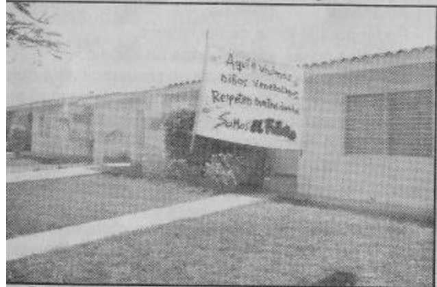
En "Semeruco", afectadas 136 familias, dispuestas a defenderse.