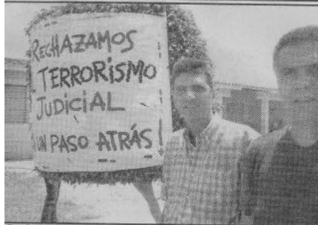
Rechazan la decisión del juez, porque legalmente todavía no están "despedidos".

primeros interesados en el desarrollo turístico regional", finalizó.