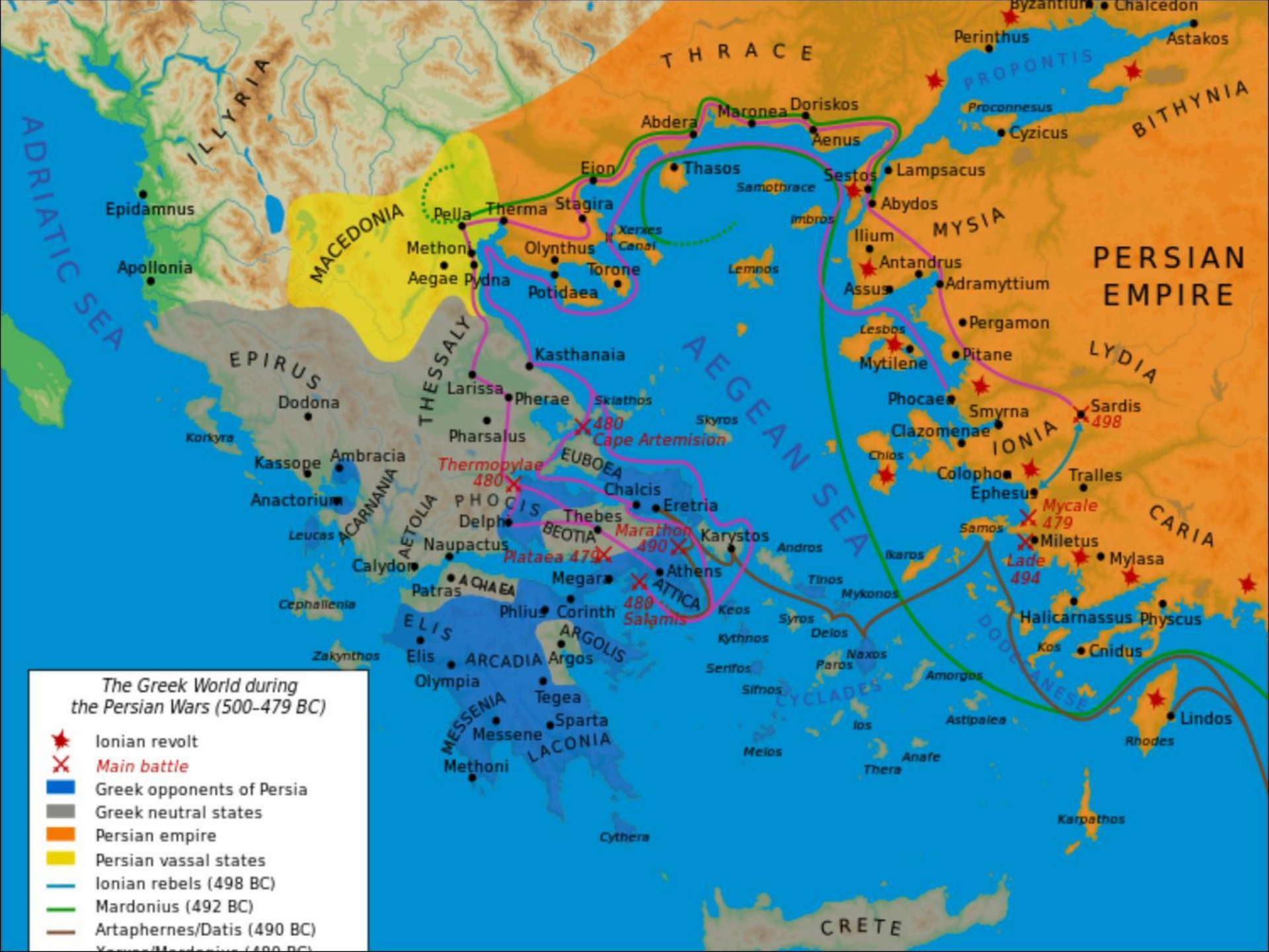
The Greek World during the Persian Wars (500-479 BC)