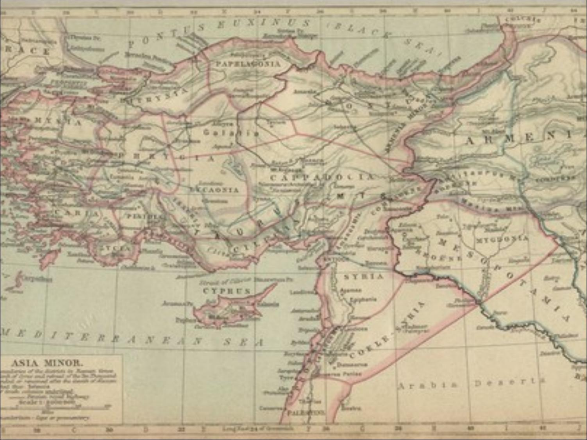
ASIA MINOR. Boundaries of the districts by Roman lines and of those and natural of the 3rd Christian era, as retained after the death of Justin and the Islamic Scale 1:100,000 Longitude - East or West