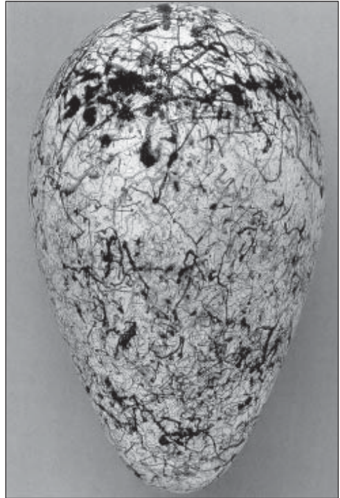
Рис. 2. Яйцо бескрылой гагарки, коллекция Ливерпульского музея (из: Fuller, 2001).

О биологии бескрылой гагарки известно очень мало. Полость рта у копыеносов была ярко-желтой, возможно это играло какую-то роль в брачных играх или при общении взрослых птиц с птенцами. В конце мая – июне самка откладывала прямо на голые камни единственное яйцо грушевидной формы. Размер его составлял 110–140 x 70–84 мм. Окраска яиц была очень разнообразной. Одна из причин, по которой яйца копыеносов в свое время так привлекали коллекционеров, – практически невозможно найти два одинаковых. Толстая