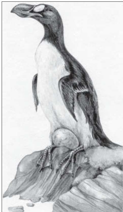
Рис. 1. Бескрылая гагарка (из: Sedlag, 1983).

лялись в густонаселенных местах Европы. Так, в 1790 г. одну птицу поймали в гавани г. Киля на севере Германии. В 1830 г. труп гагарки нашли на нормандском берегу Франции (Брем, 1902, 1999; Йовчев, 1982).