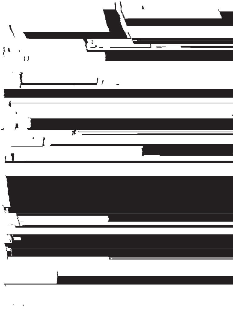
Рис. Э.Д. Шукурова.