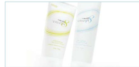
FIGURE 8 VANISH™ Sistema de 2 pasos contra la celulitis

PROGRAMA DE ADELGAZAMIENTO FIGURE 8® 4 productos lo hacen fácil 8 elementos dietéticos que realmente funcionan