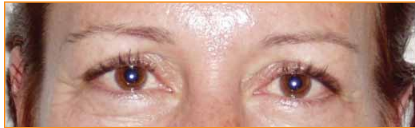
Sin NutriMinC® RE 9

¿Si usted encuentra algo que le da resultado, dejaría de usarlo?