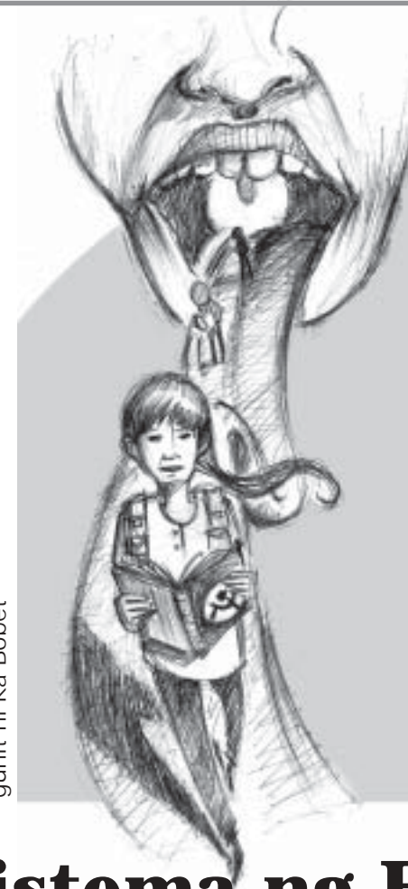
guhit ni Ka Bobet

Ang Balangay La Coste ay ang pinakahuli sa matatagumpay na bagong-tatag na balangay ng KM ngayong taong ito. 🙏