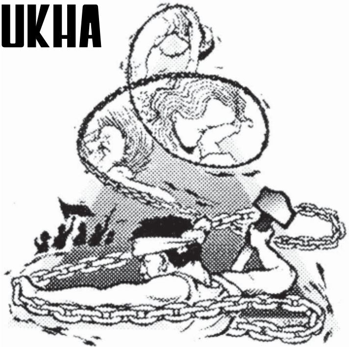
Mula sa Ulos

Tayo'y dumaraing, laging humihingi ng kandiling tapat. Sa pamahalaan, sa Mamumuhunan, at sa lagdang batas Ngunit masdan ninyo kapag dumarating ang pagpapahayag Ng di kasiyahan natin sa pakana't masamang palakad: Ang mamumuhunan, ang pamahalaan at ang mga batas Ang ating kalaban, ang sumasanla, nang ganap na ganap.