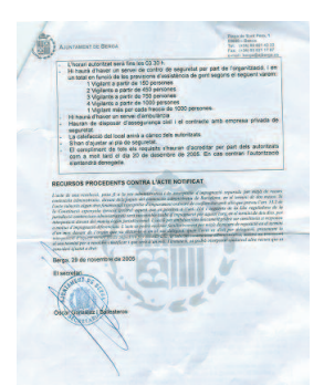
Document amb les condicions que l'ajuntament va posar a l'organització.